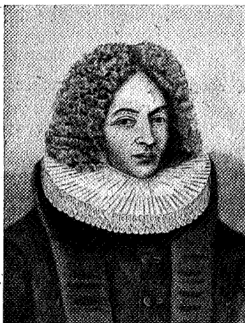
Thomas von Westen.

«I maatte dø av glæde dersom I vidste selv, hvor mange sjæle I har reddet, hvor mange præster opvakt, hvor mange hjerter I har aapnet».