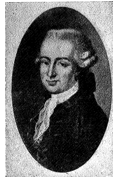
Rektor Gerhard Schøning.