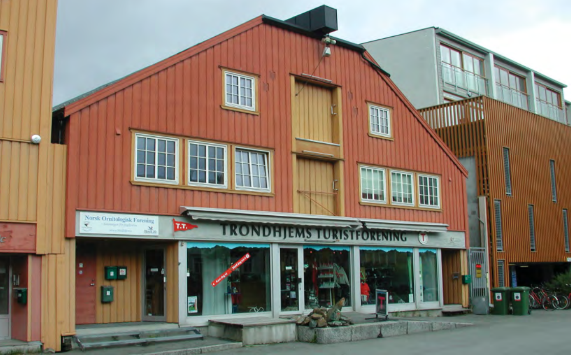
TT-brygga i Sandgt. 30.