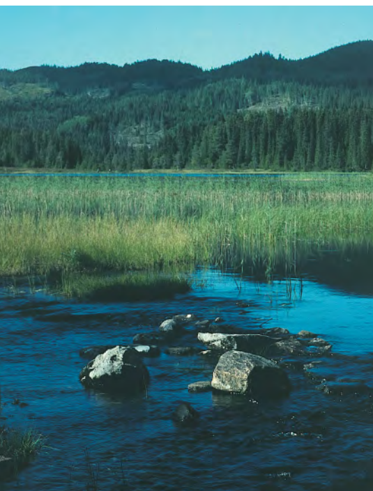
Innover Litt-Leirsjøen mot Bynesmarka.

Granåsen er kjent VM-anlegg med hoppbakker. Ved dagens langrennsstasjon lå den gamle gården Søremshallan , og under dagens hoppbakker lå, før utbygginga, Hallantjøna . Turløypa går fra den store parkeringsplassen og sør for Høgåsen (med mindre hoppbakke). Gårdsnavnet Nybrott på Smistad forteller om bureisningsbruk fra først på 1900-tallet. Til myra sør for Nybrott kommer skiløypa fra Nordmyra opp via Langdalen som en forlengelse av Svartdalen. Nederst i Langdalen ligger noen små myrer kalt Skråppåmyrene . I Elgåsen er det tett skog og mange muligheter for å stikke seg bort for skogens konge.