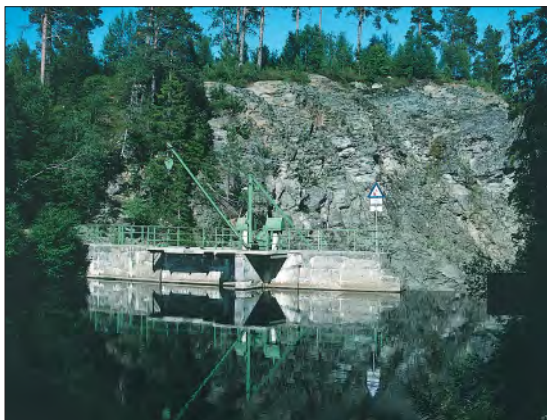
Demningen i Stor-Leirsjøen som i 2005 fikk gangbru over overløpet.

mulig forklaring på navnet kan ellers være at det har vært beiteområde for hester ved sjøen, men en gammel skrivemåte som "Hesjesjøberget" kan også bety at det kan ha sin opprinnelse fra hesjer. Vest for Hestsjøen ligger Rottåsen , og går vi nordover herfra finner vi Buskleinbekken (etter gårdsnavnet Busklein, av biskopleinar) med Bekkrokan og Vadet der bekken er grunnest. Bekken nedover til Hestsjøen er derfor kalt Vadbekken . Her er