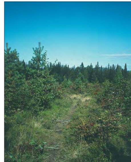
Stien nordover Sæteråsen fra Skarsleitet mot Brumyra og Leiråsen .

Sør for Lauglovatnet finner vi stedsnavnet Kolbotnan som vitner om tidligere tiders utvinning av trekull. Nederst i Sagbekken finner vi restene av ei gammel gårdssag under gården Lauglo . Opprinnelsen til navnet Purkhusaugen sør for bekken er ukjent lokalt. Her finnes heller ingen husrester. Avledning ut fra verbet å porke, dvs. å sove, er i hvert fall mer trolig enn at det her skulle vært tilholdssted for grisepurker. Den markerte åsen sør for vatnet bærer navnet Lauvåsen , her har man antakelig sanket lauv i tidligere tider.