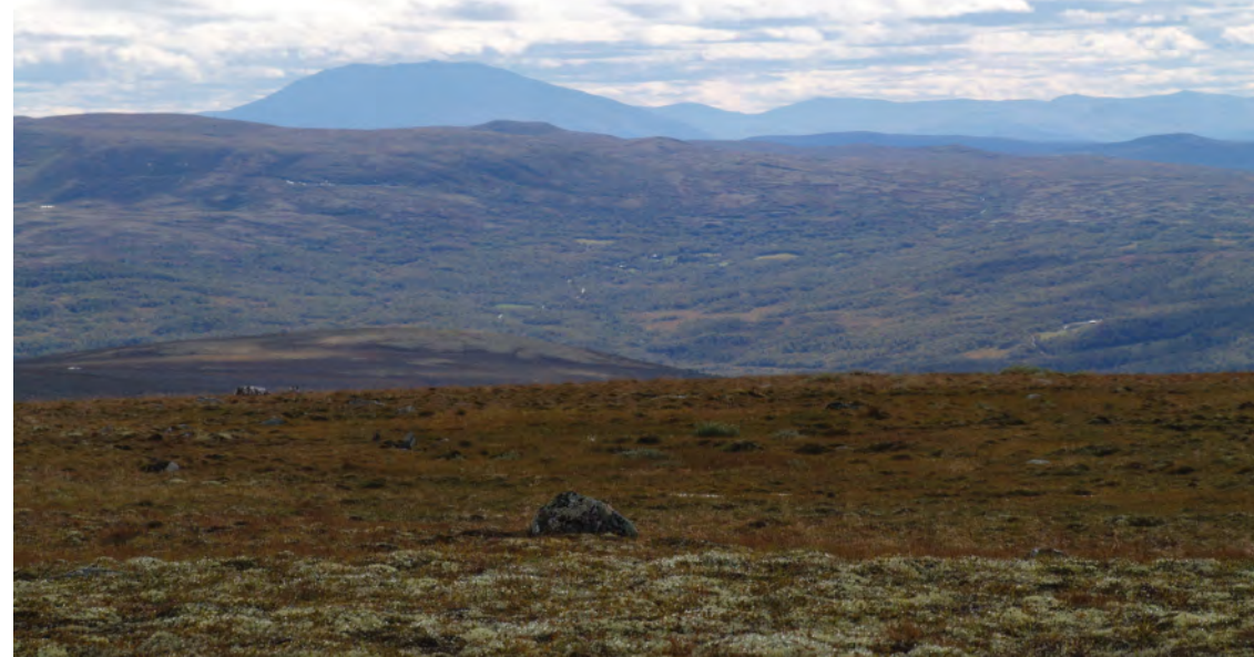
Tronfjellet reiser seg i sør.

Vi følger stien i et par km og kommer oss inn i nasjonalparken, før vi tar av og dreier sørover opp mot Åslitangen. I lia opp mot toppen er det tydeligvis kalkrik grunn. Her vokser Reinrosa og andre kalkkjære planter. Sauetråkk går i alle retninger og vitner om gode beiteforhold for alle firbeinte. Fra Åslitangen fortsetter vi langs ryggen over Dalbusjøhøgda og videre mot Dalsbygda. Selv om vi ikke befinner oss høyere enn