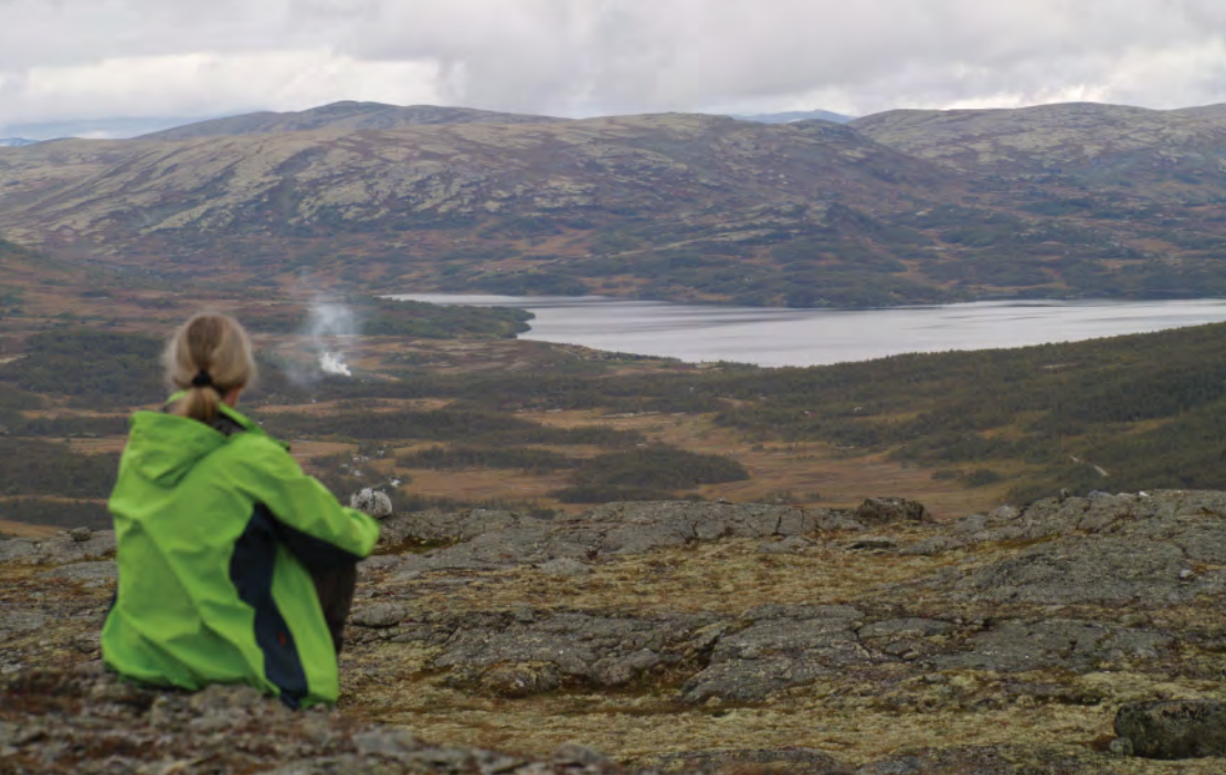
Utsikt fra Åslitangen. Dalbusjøen ligger vakkert til.