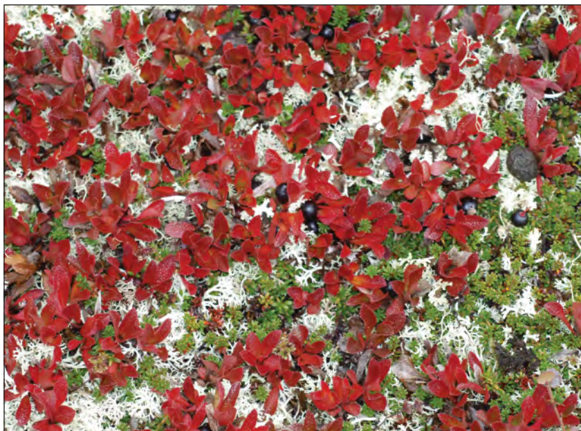
Høsten byr på praktfulle farger i fjellet.