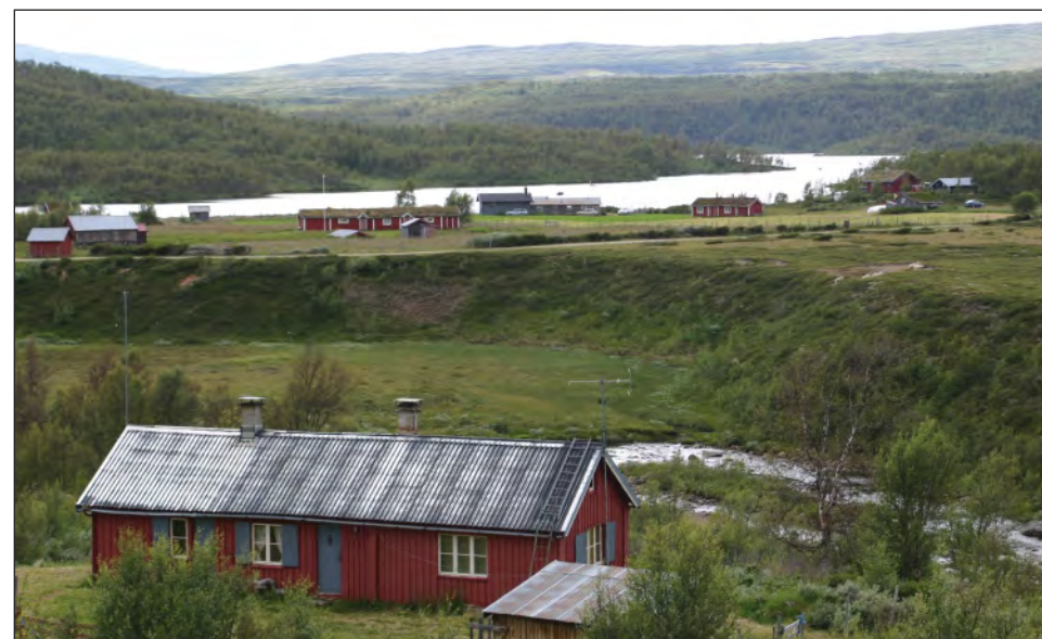
Elgsjømoen. Idyllisk setergrend ved inngangen til nasjonalparken.

Når du vandrer i disse fredelige omgivelsene, er det rart å tenke på at like i nærheten utspant det seg alvorlige trefninger mellom samer og bønder for nesten 200 år siden.