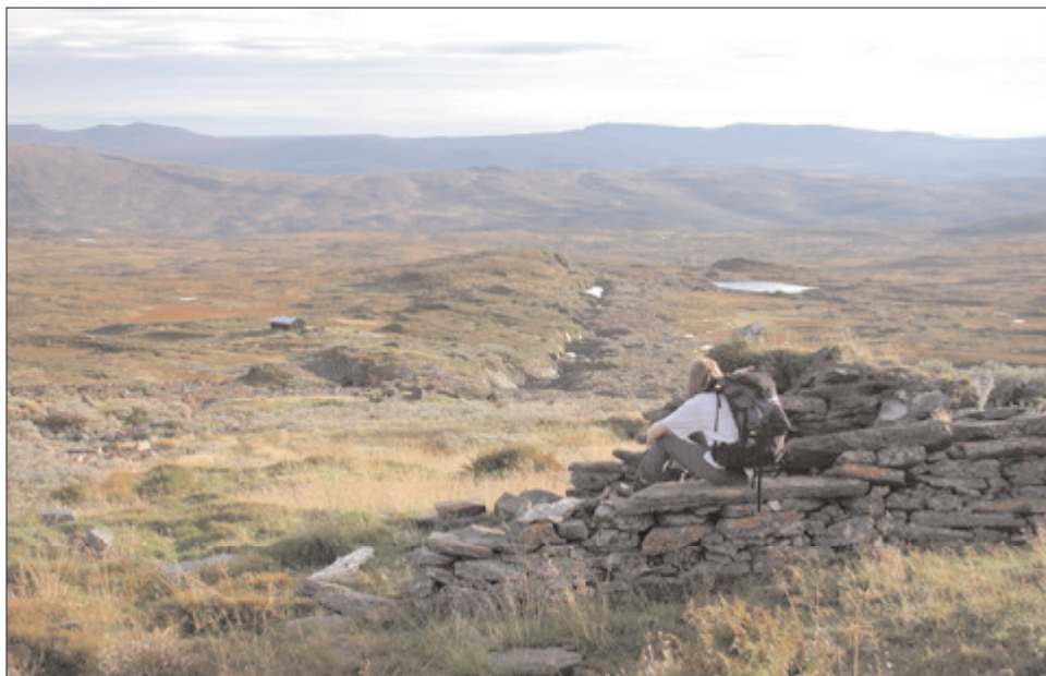
Kvernsteinsbruddet i Høgfjellet er bare ett av minnene etter virksomheter som har foregått opp gjennom historien innenfor området som nå er blitt Skarvan – Roltdalen nasjonalpark. Uttak av kvernstein tok til for 1600, kanskje så tidlig som på 1200-tallet, og bruddvirksomheten varte helt fram til omkring 1. verdenskrig. Virksomheten satte kraftige spor i landskapet. Bildet er tatt sørover langs bruddet mot de nedre deler av Roltdalen.

For friluftslivet er det samtidig viktig at det videreføres en aktiv bruk av verneområdene, bl.a. aktiv beitebruk i Roltdalen for best mulig å opprettholde et levende kulturlandskap her. TT håper dette kan skje innenfor de rammer som vernet nå setter. Å ha i behold urørt natur som er vernet som en stor nasjonalpark bør gi mange muligheter for et lokalsamfunn. TT ønsker å videreføre en mest mulig natur- og kulturbasert og miljø- og lokaltilpasset drift på Schulzhytta. Det beste hadde vært om drifta av hytta kunne skje innenfor et lokalt samarbeid i området om natur- og kulturmiljøbaserte aktiviteter og tilbud.