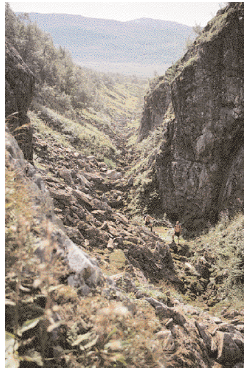
Skarvan – Roltdalen nasjonalpark har mange minner etter isens tilbaketrekning for om lag 10.000 år siden. Det er store dimensjoner over dette overløpasset langt opp i Roltdalen like ved ruta mellom Stordalen i Meråker og Schulzhytta. Vatn som rant under isen østfra grov ut dette passet. Da isen smeltet, ble den store elva under isen avsatt som den brede og 8 km lange eskeren østover langs det som nå er demmet opp som Finnkoisjøen. Vatnet som rant under isen kom fra områdene på svensk side av grensen, passerte gjennom Esandbassenget, Sankåpasset og Skarpdalen og rant ut i Roltdalen. De store vannmengder rant her noen hundre år og grov ut den svære kløfta.