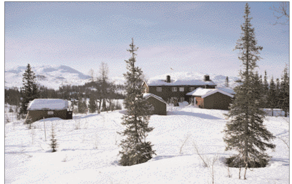
Schulzhytta ligger fritt til i åpen fjellgranskog ved setergrenda Stormoen i kjernen av den nye nasjonalparken. Ruten og Melshogna avgrenser Roltdalen i sørøst.

Det bør aldri være noen overraskelse for noen at TT i alle sammenhenger vil arbeide for å sikre friluftslivets interesser. TT har gjennom en periode på mer enn 25 år arbeidet for å unngå veger og kraftutbygging i Roltdalen og å få vernet disse enestående gjenværende