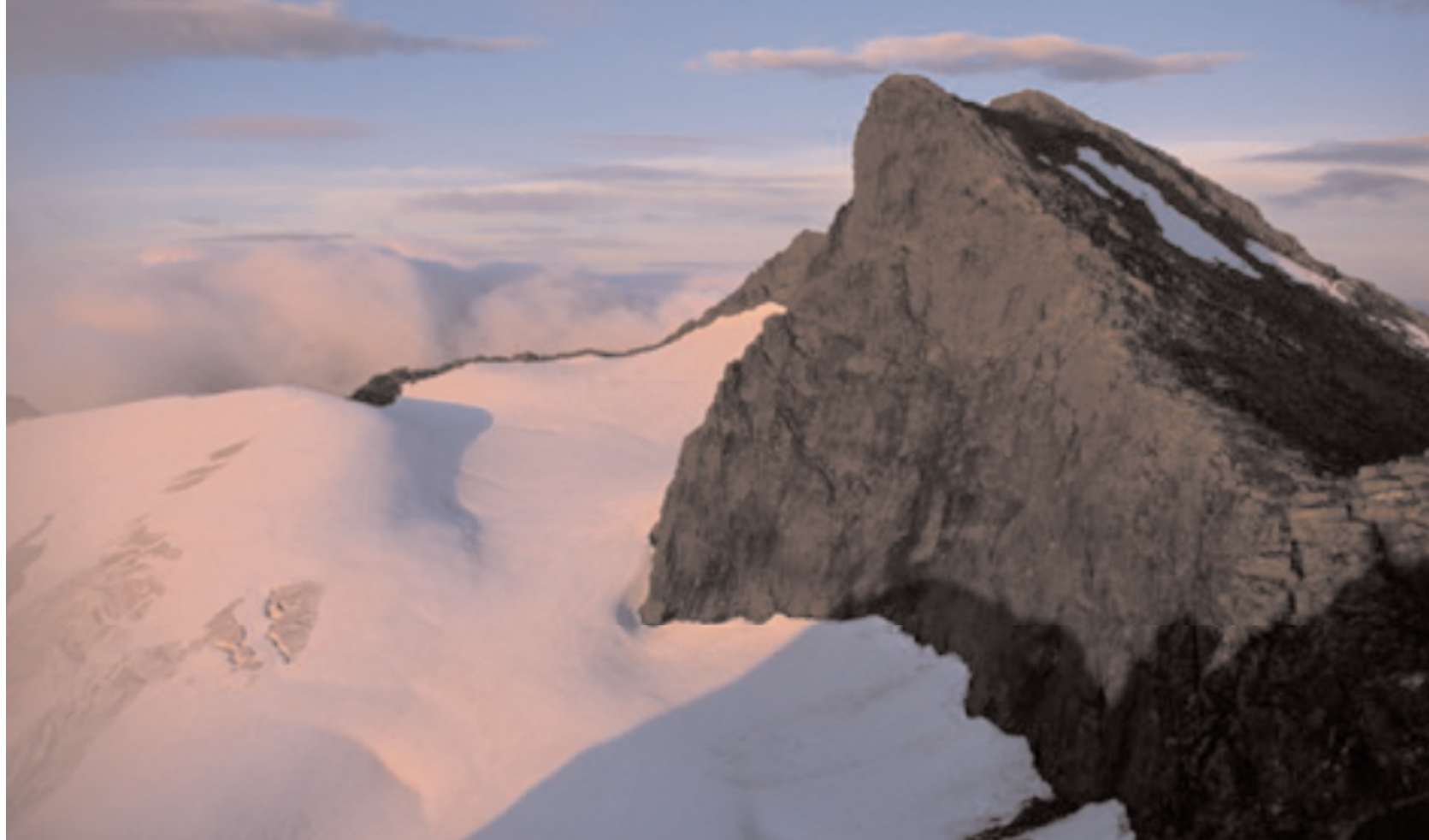
Soloppgang over Storsylen kl 03.30. Fjellet er raudfarga og varmt der den lyse natta går mot dag.

munnspel og tek nokre fjelltonar i storslått utsikt her i grensefjella.