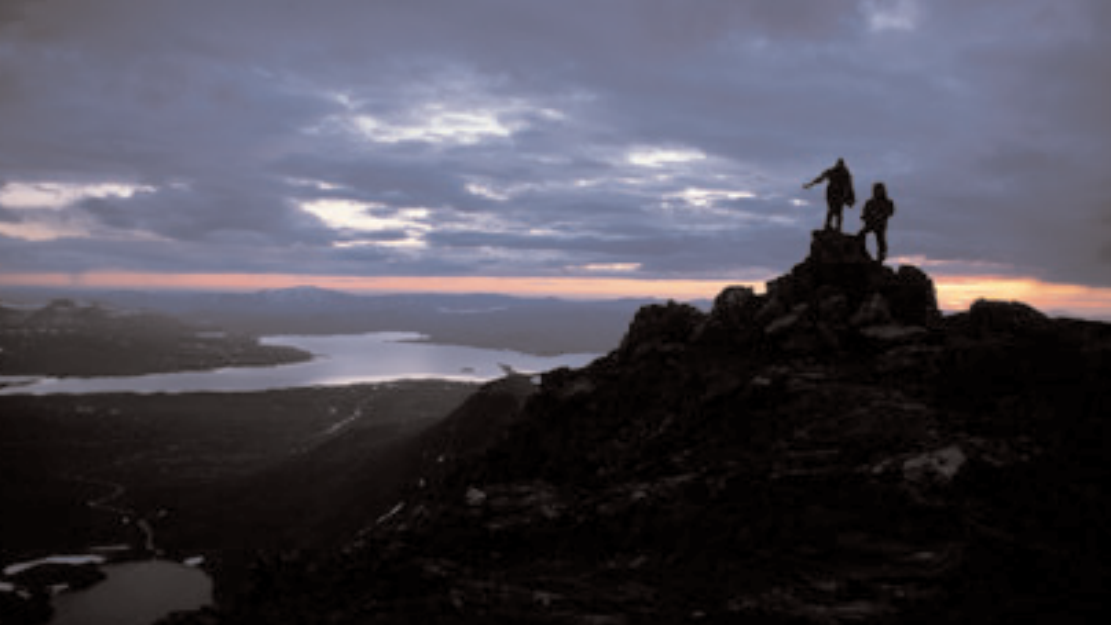
Solnedgang på toppen ca 23.30. Storslått utsikt med det store kraftmagasinet Nesjøen – Esandsjøen i vest. Syltjøna nede t.v.