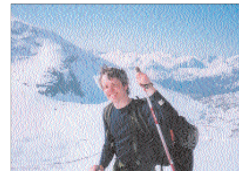
Tekstforfatteren tar en pust i bakken på veien til Ryssdalsnebb.

«Topptur à la Egil» hørtes i utgangspunktet så spennende ut, at det fikk undertegnede til å komme seg opp av sofaen og melde seg inn i TTF. Ut fra oppmøtet å bedømme, var det flere som syntes at det var en god idé å la Egil bestemme hvor telemarksvingene skulle settes denne helga. Etter oppmøte og ompakking i biler ved Lerkendal stadion, dro vi til Oppdalsporten for nytelse av «norsk tradisjonsmat», som er pommes frites og løvbiff, om vi skal tro vertskapet der.