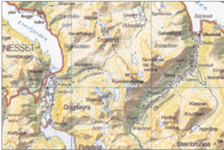
Dette utsnittet av Statens kartverks kart i målestokk 1 : 250 000, i Norgesatlasen viser området mellom Eresfjorden/ Eikesdalsvatnet og Øksendalen.

kunne fortelle at det stemte. 3 km i luftlinje og ca. 1200 meter opp lå toppen. Ikke mye bortkasta energi på transportetapper med andre ord.