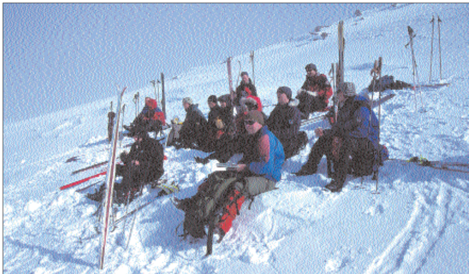
Lunsjen ble inntatt før vi gjorde det siste støtet mot toppen av Skjorta. Vi hadde også håp om at tåken rundt toppen skulle lette, noe den dessverre ikke gjorde.

tanke siden jeg hadde vært så snill å spandere på meg nye skifeller før denne turen. 50 mm coll-tex feller ga firehjulstrekk oppover på mine moderat brede Fischer E109. Ingen gliptak eller klabbet. Føret var også glimrende. Hard skare som så ut til å kunne løse litt om det kom mer sol. Selve toppen lå og gjemte seg i en liten sky, så vi hadde det ikke så travelt med å komme inn i tåkeheimen.