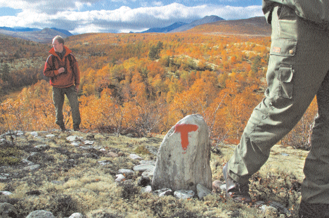
Vær ikke redd for å tenke utradisjonelt. Her har fotografen lagt seg på bakken og knipset akkurat i det turkameraten er på vei ut av motivet. Samtidig er fin balanse i bildekomposisjonen.