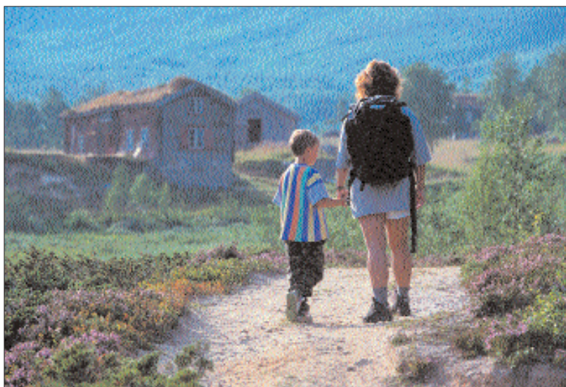
Her er hovedelementene plassert i «det gyldne snitt». Personene er på vei inn i eventyrriket og dette gir næring til fantasien. Komposisjonen skaper en forventning om at noe vil skje, turen er akkurat startet.