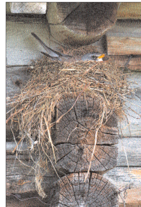
Her er motivet mer midtstilt. Dette gir inntrykk av ro og harmoni.

Sol og finvær kan gi store kontraster og mørke