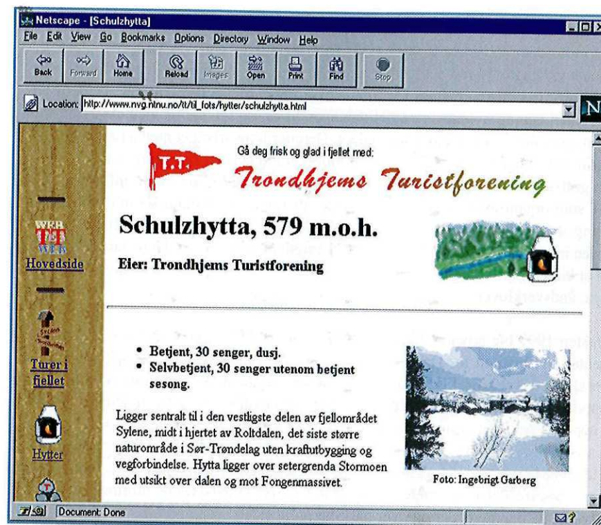
TTs internettisider gir deg tips om betjente og ubetjente hytter.

En annen viktig målsetting er å avlaste TTs driftsorganisasjon ved å tilby en ekstra informasjonskanal på internett. Tradisjonelt har mye informasjon blitt gitt via telefonhenvendelser til TTs kontor. Nå når det foreligger alternativ informasjon om TT på internett, vil noen istedet kunne lete opp det de trenger her (spesielt hvis telefonlinjen til TT er opptatt), og antall telefonhenvendelser vil kunne avta. Dette tror vi spesielt kan være gunstig i f.eks. påskesesongen hvor "hele Norge" skal på tur samtidig.