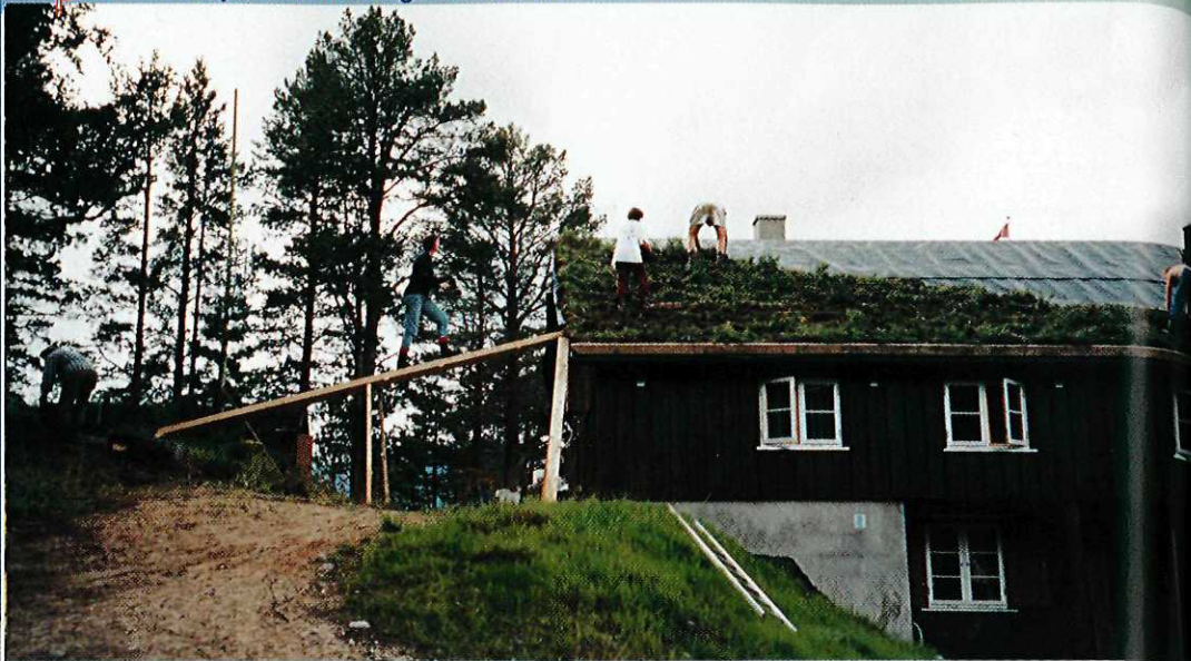
Godt i gang på den ene sida av nyfløya. Så er taket grønt og fint, klart til å ta imot både høstregn og snø i alle varianter.