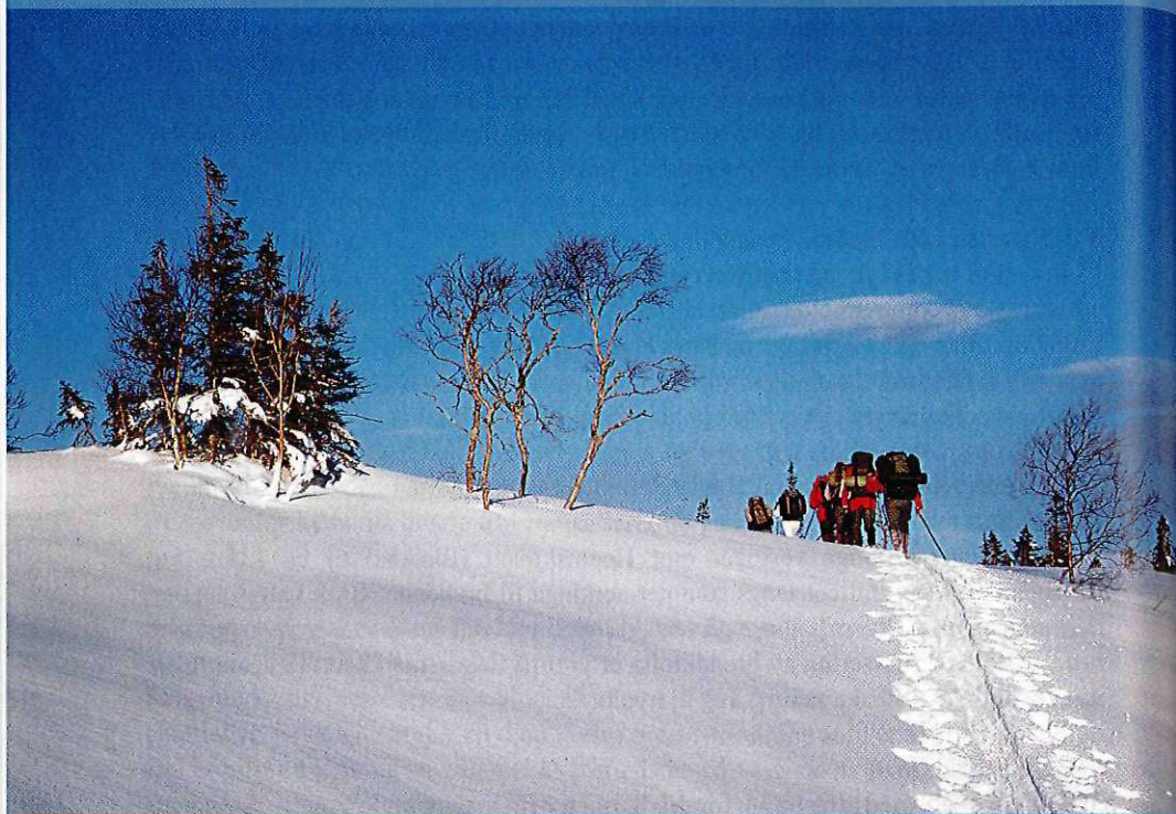
Morgenstemning på tur til Høgfjellet.