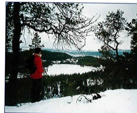
Utsikt fra Stavsjøfjellet over Stavsjøen og nordover Trondheimsfjorden.

Vi skal oppsøke Stavsjøfjellet (ca. 340 m), med dramatiske stup og ny utsikt. Fra Skarpåskjølen holder vi nordøstover til vi kommer til myra (275 m) rett under Merkespynten i sørvestenden av Stavsjøfjellet. Opp på fjellet kommer man lettest på sørsiden av Pynten, men vår snedige variant sniker seg inn i skogbrynet nordover, under stup til vi kommer til kraftlinja og en gammel traktorvei opp på myra nord for Pynten. Myra ligger langs kanten av stupet, og vi ser ned på Stavsjøen og utover Trondheimsfjorden.