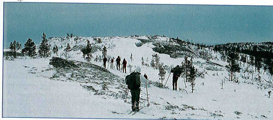
Jervfjellryggen gir utsikt ned i Malvikmarka og innover mot fjella i Sylan.

Følg åpen glenne etter traktorveg (ikke inn-tegna på kart 1:50 000, men på turkartet) nordover, siden østover og i utsprengt rampe bratt opp til myrsøkket nord for Sjøvidthøgda. Herfra tar du over kollen nordafor (Tiurhaugen) (460 m), og kjører i friske heng i djup-sjøen ned til søkket nordvest for Bjørnstad-