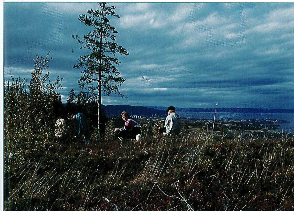
Utsikt er det mye av på turen over Aunvåtten. Himmelen er stor og fjorden ikke mye mindre.

Turen videre til utsikten nord på Aunvåtten (261 m) er på ca. 2 km. Her kan du velge mellom to traseer (se kartet). Den østlige traseen går i lettest terreng. Den følger ryggen framover til det markerte søkket (275 m) som dan-