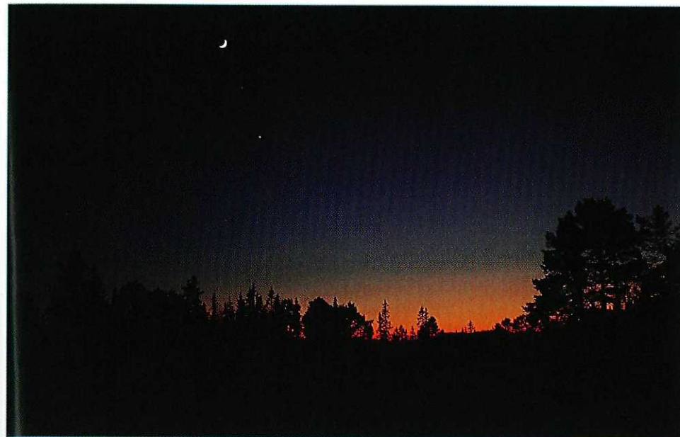
Svakt måneskinn over myrlandskapet før Solemsåsen.

altfor breie "motorvegene" av noen VM-løyper nordvestover opp til myrdragene. Vi tar den vanlige turløypa som snarveg rett før vi