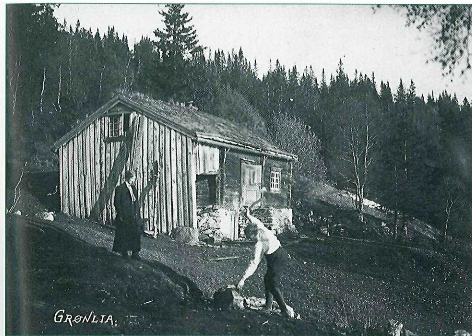
Slik så det ut i Grønlia i 1914. Postkort utgitt av Thoralf Dahl, Trondheim.

gen (290 m) som også gir muligheter til å nyte utsikten - langt inn i fjellheimen mot sør og øst. Langs traseen ligger mange av boligene i Lianområdet - ofte ombygde hytter fra førbilismens tid, men også hus hvis plassering sikkert kan diskuteres. Vi følger stien som tar av vestover forbi den siste bebyggelsen. Vi kommer innpå traktorvegen mot Stykket, tar