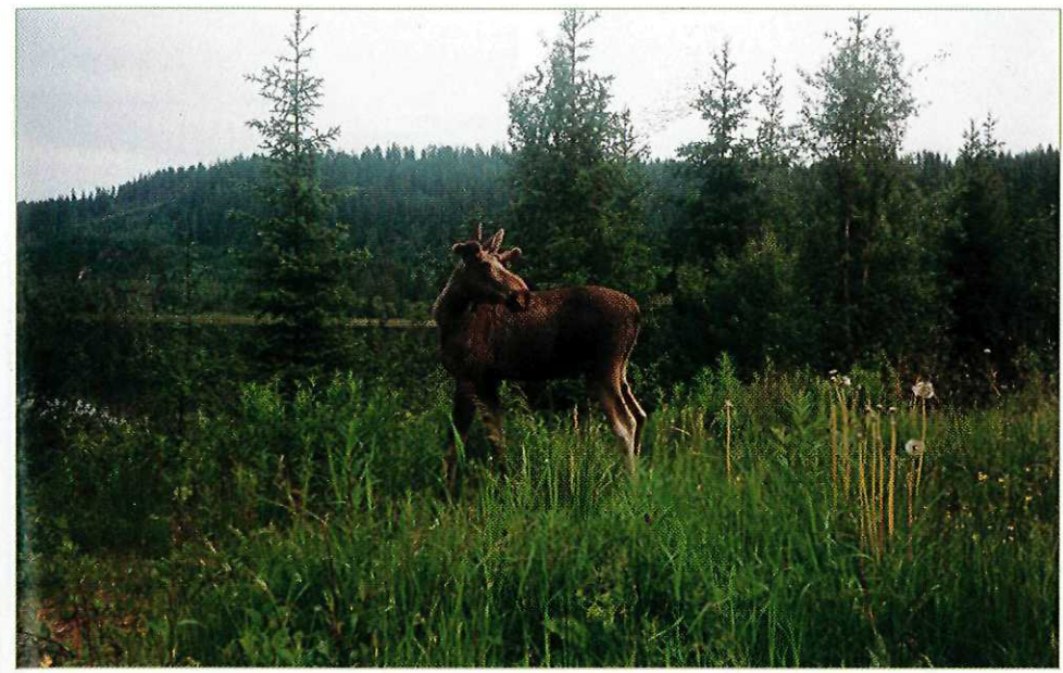
Elg i Leinstrandmarka.

På slutten av 1960-tallet startet en svær utbygging i Heimdalsområdet. De gamle gårdene Kolstad, Huseby, Saupstad og Kattem ble utbygd med blokker og rekkehus. Senere skjedde det samme med Lund og Flatås og store områder på Heimdalsmyra lenger øst (Tillerbyen). Turtrafikken i den tilgrensende marka har økt formidabelt både i takt med utbyggingen og den allmenne økningen i friluftsliv. Deler av det store myrpartiet på Nordmyra er blitt oppdyrket. Her er det fellesfjøs og beitende kyr på sommers tid. Om vinteren går tursktrafikken i stor grad langs en akse fra Saupstad over Nordmyra og opp til Smistad og videre vestover i retning Rønningen. Lenger nord er området rundt Granåsen mye benyttet. Det er tilrettelagt for direkte tilgang til marka fra boligområdene gjennom turveikorridorer og gangbruer over Kongsvegen. I den østlige delen er et større lysløypenett. Om sommeren er trafikken mer spredt. Gode turstier som hovedadkomster innover marka og som hovedstier i nærterrenget, er ikke opparbeidet. O-laget Trollelg har moderne o-kart over området og tilbyr turorientering. Turforslagene som følger, er mest egnet som sommerturer, og kan varieres, snus og kombineres etter fysisk form og startsted.