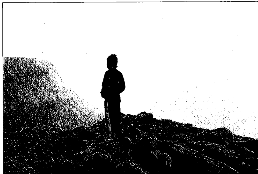
Gjennom Ekorndörren gikk pilegrimstrafikken til og fra Trondheim i flere hundre år.

De fleste som passerte gjennom disse fjellovergangene var nok jämter. Slik kan vi snakke om en dominerende vestlig trafikk, sjøl om folk naturligvis etter endt ærend i Trøndelag siden gikk samme lange og harde vei tilbake. I mange hundre år sto jämtene i en mellomstilling i forholdet til Norge og Sverige. To