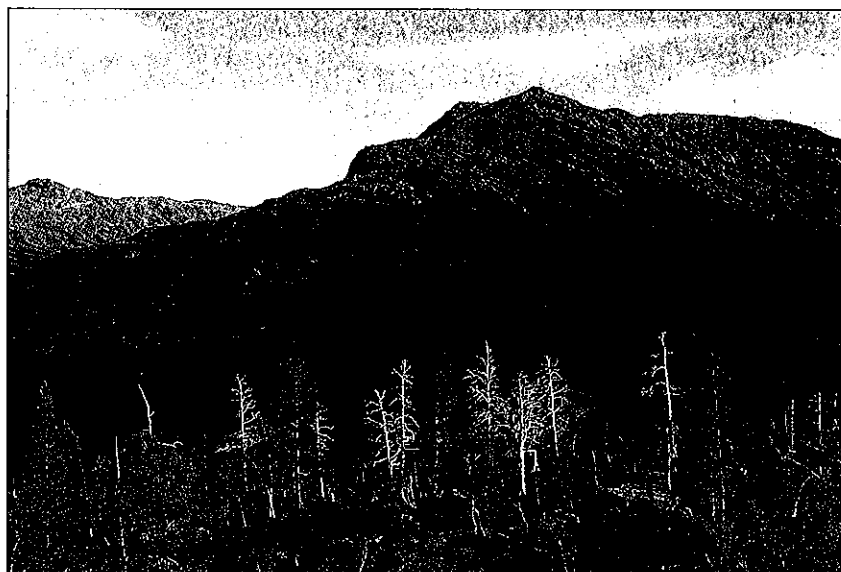
Tørrfuruer er et karakteristisk trekk i Folldalen.

Berggrunnen i Trollheimen er variert. Deler av området i øst (Gjevilvasskamman, Mellomfjell, Falkfangerhø, Høghø m.m.) har skifer og andre næringsrike bergarter som gir et godt og næringrikt jordsmonn, og danner grunnlaget for en særlig rik fjellflora. Geologien og skiftingene mellom høgfjell og skogkleddedaler fører til at området byr på større mangfold av planter og dyr enn de fleste andre fjellområdene våre.