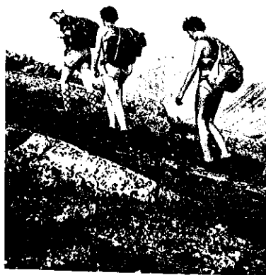
ÅRBOK 1957 TRONDHEIMS TURISTFORENING