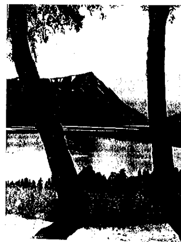
ARBOK 1951 TRONDHJENS TRISTFORENING