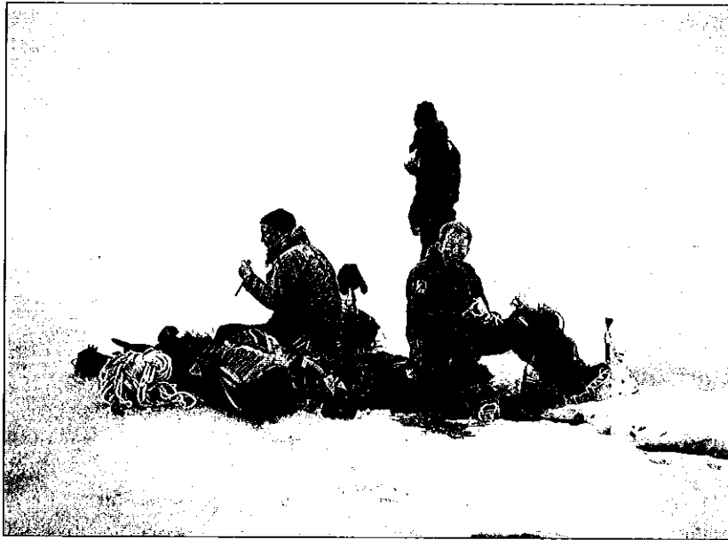
Brevandring er en av aktivitetene i Fjellsportgruppa.

eller sagt noe som så blatant har brutt idyllen at andre har sett det nødvendig å formidle litt om den rette lære. For så å la stillheten senke seg igjen. Fjellsportgruppa har aldri vist seg homogen nok til å være aktiv i naturvern-sammenheng. Det hadde kanskje vært nyttig om TTF kunne være et korrektiv til turistforeningssystemet av og til.