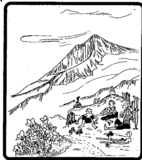
Forside av Fjellsportgruppas medlemsblad «i Hytt & Vær». Tegning: Christine Fichler-Fettig.

Grunnlinjene i gruppas aktivitet har vært temmelig uforandret fra disse første årene. Turprogrammet har hatt vinterturer med teltovernattinger både i høgfjell og i nærterreng. Vårskiturene er gjerne gått til breområder, og har strukket seg over romslige mai-helger. Sommerleirene har vært lagt til steder med muligheter for bre- og klyveturer. Lyngen, vestlandet, Jotunheimen og Lofoten er populære gjengangere. Høsten har vært en relativt rolig tid, med vekt på hytteturer. Det har også vært et ønske om å bruke offentlig transport framfor privatbil, og at flesteparten av turene ikke skulle være for langt unna. Man skal ikke "reise på tur".