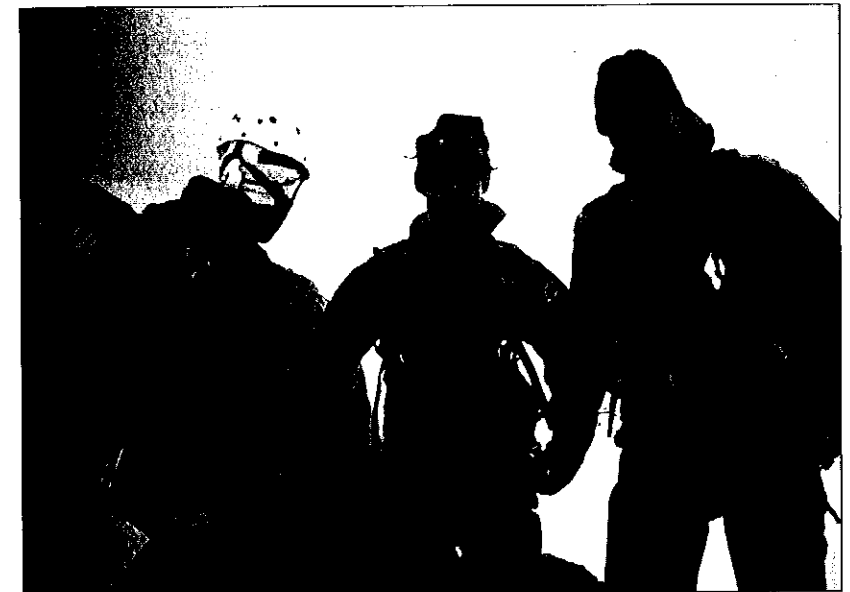
Fra toppur i Lyngen.

Fjellsportgruppas formål er å være et sosialt samlingspunkt for fjellsportinteresserte med virke innenfor Trondhjems Turistforening. Den vil i første rekke arbeide for å: a) -styrke sikkerheten og den personlige egenferdigheten