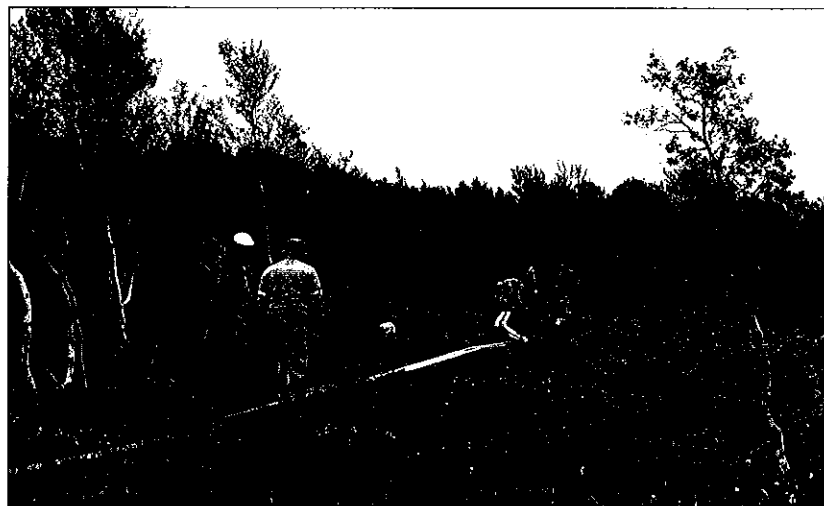
Planklegging på "Risanmyra" i Remskleppen.

Kameratskapet, friluftslivet og tanken på at nyttig arbeid ble utført, var driv-