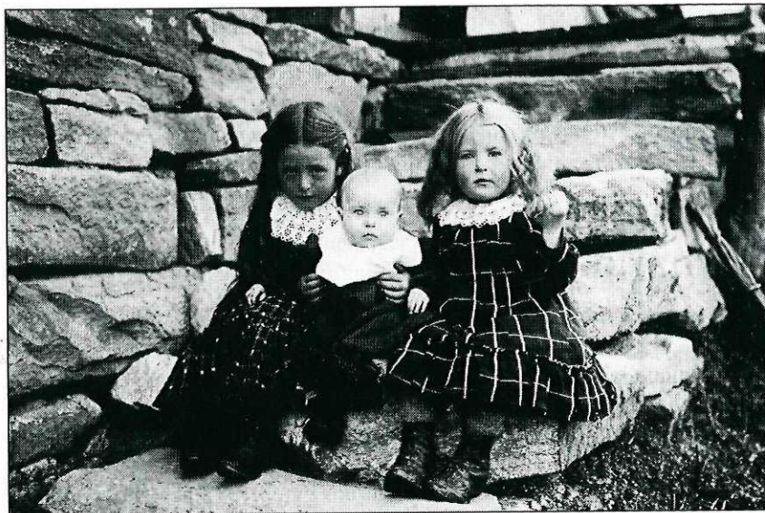
Påskriften tyder på at de to jentene og babyen er fotografert i august 1912. Men mer er det vanskelig å si om bildet. Muligens skriver det seg fra Storlidal-fotografen Lars Vaslis samling, men dette er et spørsmål ordningen og registreringen av det store gamle billedstoffet må søke å gi svar på.