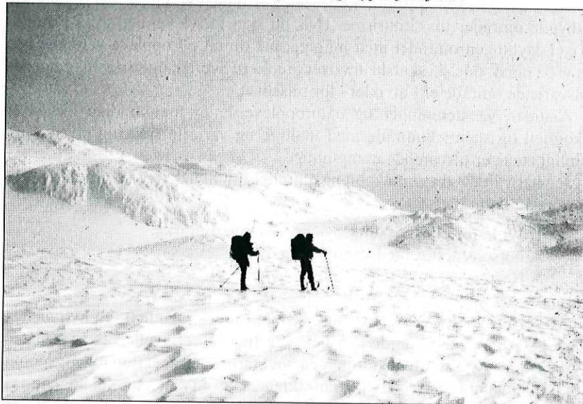
Skardørsfjella og Vigelfjella er et fjellmassiv hvor det er greit å ta seg fram over topper og rygger - et eldorado for varierte skiturer.

kvartermulighetene som finnes her. Alle disse turene er lange, så det bør være lette snøforhold, du bør være i bra form og helst bør det være flere som kan bidra til å trække spor: