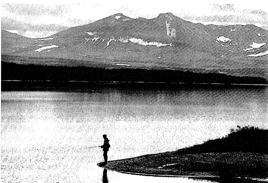
Essandsjøen byr fortsatt på godt røye fiske, men før reguleringene i Nedalen ga sjøen grunnlag for et rikt næringsfiske.

I Selbu byr Rotla på gode muligheter. Fra Selbusjøen samt fra Nea og Usma går fisk opp i mindre vassdrag. Usmesjøen og Hilmotjørnin har bra ørretfiske.