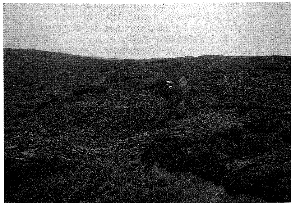
Kvernsteinbrytinga i Selbufjellene har etterlatt seg dype spor.

Til å sprengte ut kvernsteinmennene ble det i den eldste perioden hugget en rad med hull i berget. Så ble trekiler slått inn i hullene helt til flaket løsnet. Men dette lyktes ikke hver gang, og flere steder står kilene ennå igjen i hullene. Fra ca. 1700 ble krutt tatt i bruk. Denne utsprengingen etterlot tydelig spor etter mineborene. Effektiviteten i brytingen økte nok betraktelig da denne nye teknologien fant vegen inn i kvernfjellet. Sledelassene ned til bygda gikk tett,