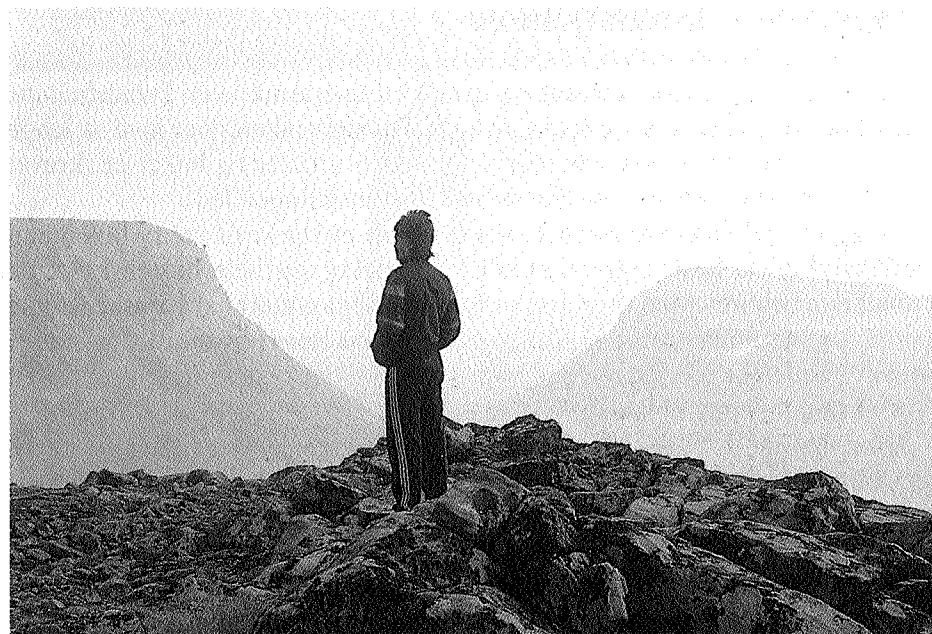
Gjennom Ekorndörren gikk pilegrimstrafikken til og fra Trondheim i flere hundre år.

De fleste som passerte gjennom disse fjellovergangene var nok jämtar. Slik kan vi snakke om en dominerende vestlig trafikk, sjøl om folk naturligvis etter endt ærend i Trøndelag siden gikk samme lange og harde vei tilbake. I mange hundre år sto jämtene i en mellomstilling i forholdet til Norge og Sverige. To