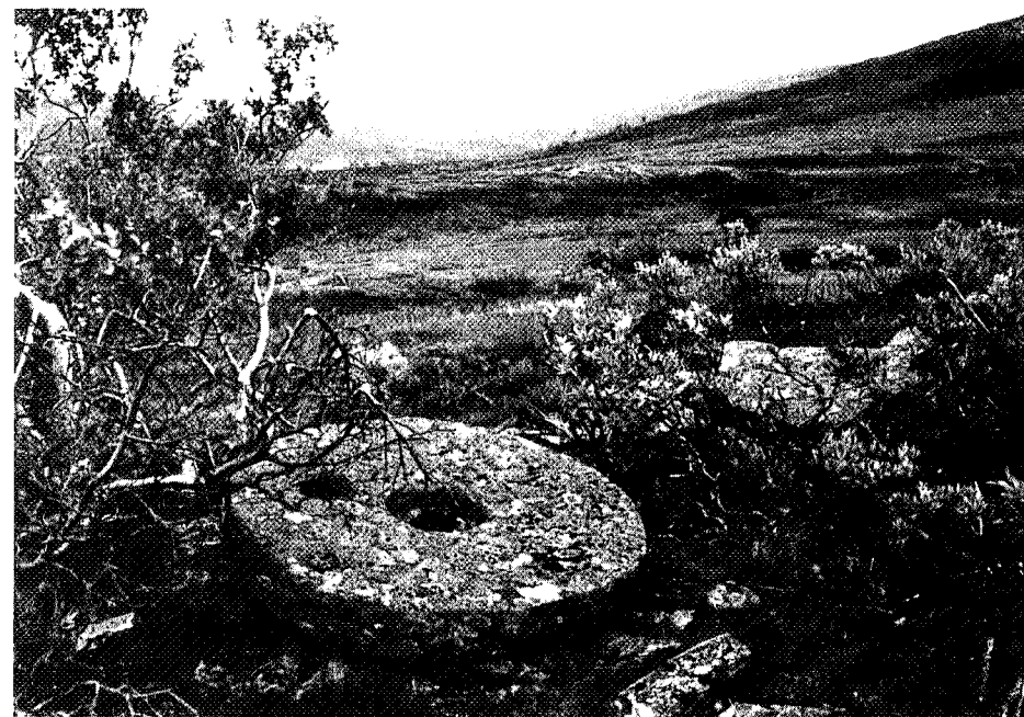
Over Høggjellet sommers tid er sporene etter kvernsteinbrytinga lett å finne.

Vinterstakingen følger i store trekk samme rute. Den gamle stakingen mellom Schulzhytta og Storerikvollen gikk nord for Ramfjellet, og tar av fra stakingen mot Bjørneggen ved Knollen.