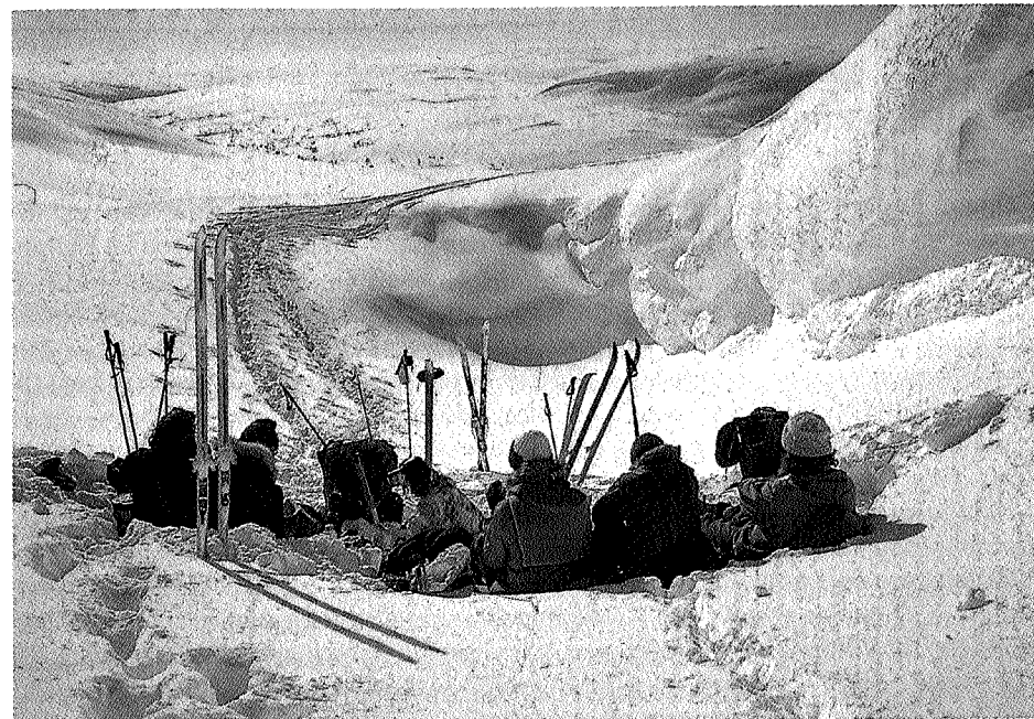
Selv vinters tid kan det bli varmt i en solhelling langt til fjells.