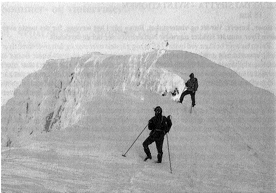
Syltoppen ligger såvidt inne på norsk side. Vinters tid er toppen lettest tilgjengelig fra svensk side. En bratt, men fin tur.