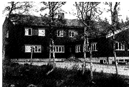
Nedalshytta ligger i bjørkeskogen ovenfor Nesjøen.

Adkomst fra Stugudalen i Tydalen, veg helt inn (ikke vinterbrøytet), parkering ved hytta. Vinters tid grei skitur inn fra Stugudalen, ca. 15 km, vinterstaket.