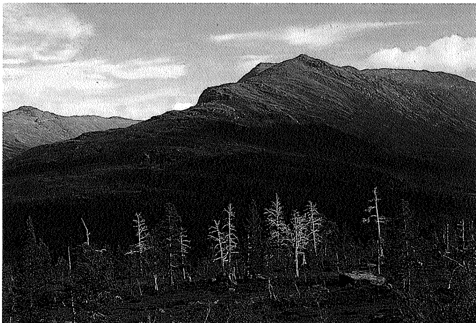
Tørrfuruer er et karakteristisk trekk i Folldalen.

Berggrunnen i Trollheimen er variert. Deler av området i øst (Gjevilvasskamman, Mellomfjell, Falkfangerhø, Høghø m.m.) har skifer og andre næringsrike bergarter som gir et godt og næringrikt jordsmonn, og danner grunnlaget for en særlig rik fjellflora. Geologien og skiftingene mellom høgfjell og skogkleddedaler fører til at området byr på større mangfold av planter og dyr enn de fleste andre fjellområdene våre.