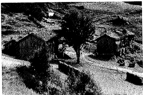
Den gamle Innerdalshytta som ble avløst av en ny moderne hytte i 1989.