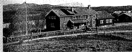
Jøldalshytta ligger vakkert til ved Jølvatnet.

Adkomst fra Oppdal, seterveg (bomveg). Parkering nedenfor hytta. Brøytet til Osen ved sørenden av Gjevilvatnet, parkering, 8 km til hytta. Buss til Festa, 12 km fra hytta.