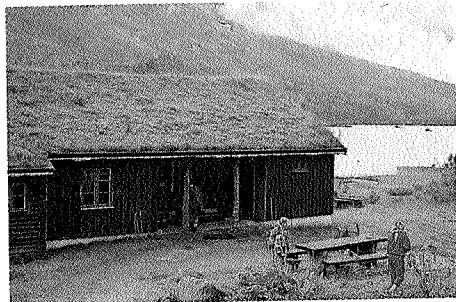
Renndølsetra er tidligere seter for gården Opdøl.