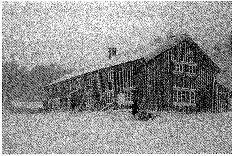
Trollheimshytta er et godt bevart turist-hytteanlegg.