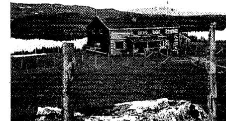
Jøldalshytta før påbygningen i 1962.