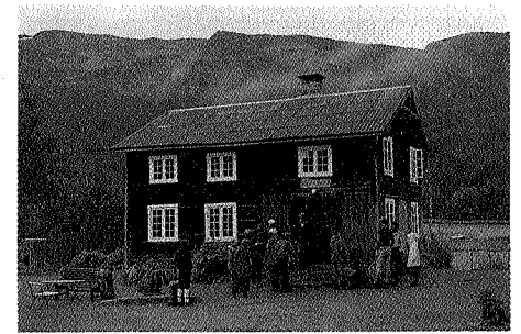
Selvbetjeningskvarteret på Kårvatn ligger i «Målastuå».

Innerdalshytta ble reist på gården Innerdalen i 1889. Ny hytte tatt i bruk i 1989. Seterkvarter på Renndølseter siden 1949.