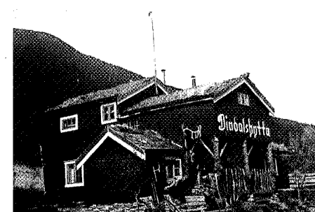
Dindalshytta slik Hjalmar Olsen bygde den på 1930-tallet.