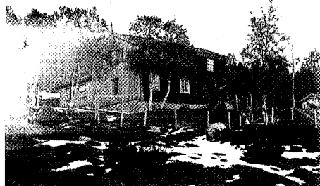
Sliperstua, den eldste delen av Gjevilvasshytta, ble innviet i 1922.