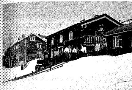
Bårdsgarden med selvbetjent kvarter i en del av hovedbygningen.

Da Bårdsgarden i 1977 ble etablert som selvbetjent kvarter, avløste den det betjente kvarteret Kåsa, der TT hadde leid bygningene siden 1948. Tidligere hadde TT kvarteravtale med Bortetua gård i Storligrenda.