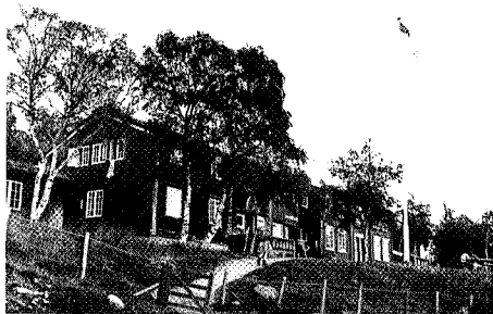
Gjevilvasshytta er et fredet hytteanlegg.