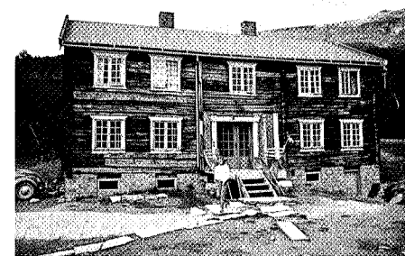
Kåsa var TT-kvarter fra 1948 og fram til 1977.