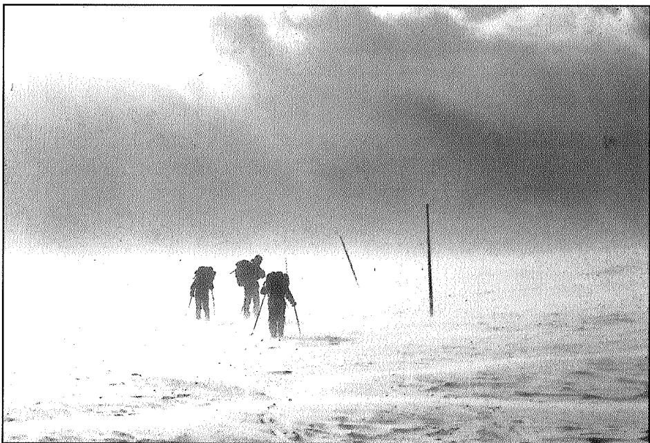
I Sylene er de viktigste vinterrutene permanent staket.

påske og 8700 i sommersesong. Vel 4100 overnattinger var på selvbetjente hytter/kvarterer. I tillegg kommer ca. 3000 overnattinger på utleide betjente hytter utenom sesong.