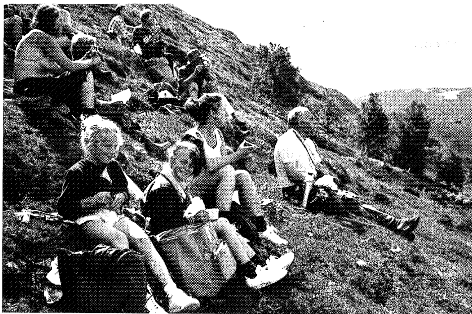
Pause i bakken under en av professor Olav Gjærevolls mange botaniske vandringer i regi av TT.