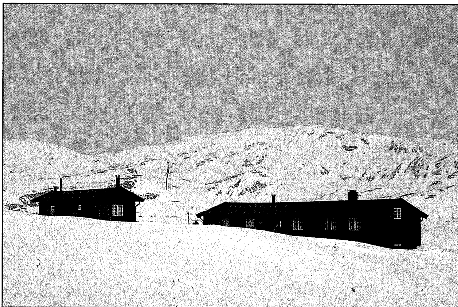
De fleste av TT-hyttene er ubetjente. Til Ramsjøhytta f.eks. må fjellvandrerne ta med seg lånt nøkkel.