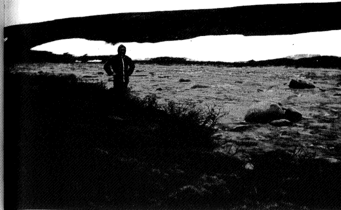
Ved Minilla 24. juni 1984. Det var ennå mye snø igjen i fjellet, og været var dessverre ikke det beste – med bare 3 – 4 plussgrader, regn, sludd og kald vind.

Vor hjemmelsmann paa Sundalsøra hadde fortalt os at paa Osbua var der baade logi og mat aa faa. Dette stolte vi paa, saa vi hadde ikke tatt med mere mat en vi beregnet nødvendig til Osbua. Denne formiddagen hadde vi hat en avskrekkende appetit saa de deilige smørrebrød vi fik med fra Dalen forsvandt i en fart. Ved