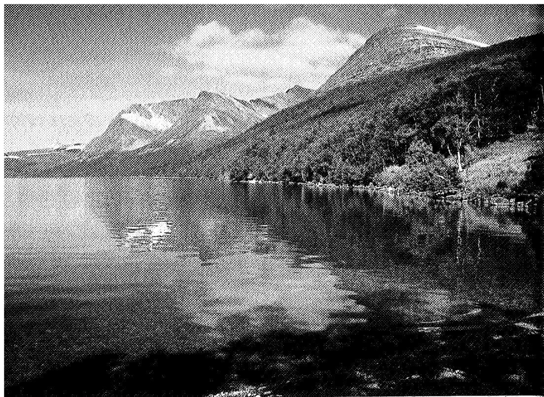
Ved Gjevilvatnet mot Rensbekksetra.