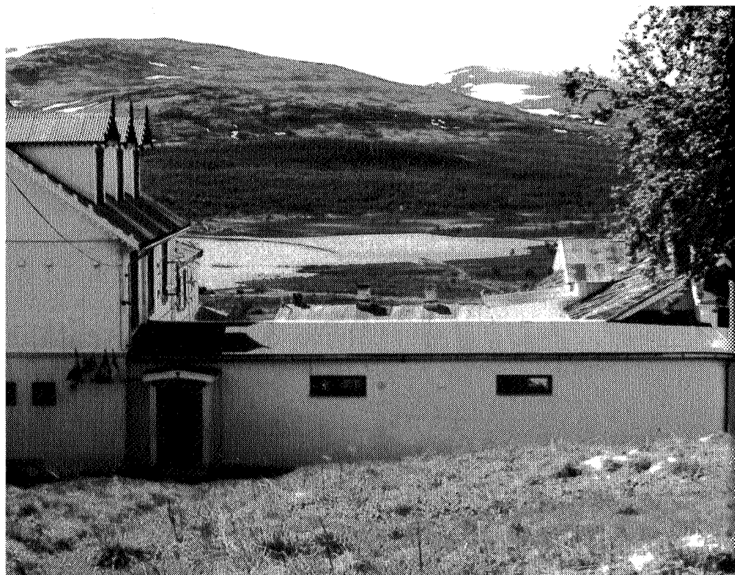
Nåværende Hjerkin fjellstue. Rester etter den gamle fjellstua er gravd fram på Veslhjerkinnhøgda (i bakgrunnen omtrent midt på bildet) (SVEIN LOENG)