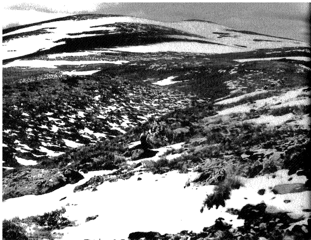
Halvfarhø (1685 m.o.h.) sett fra sørøst