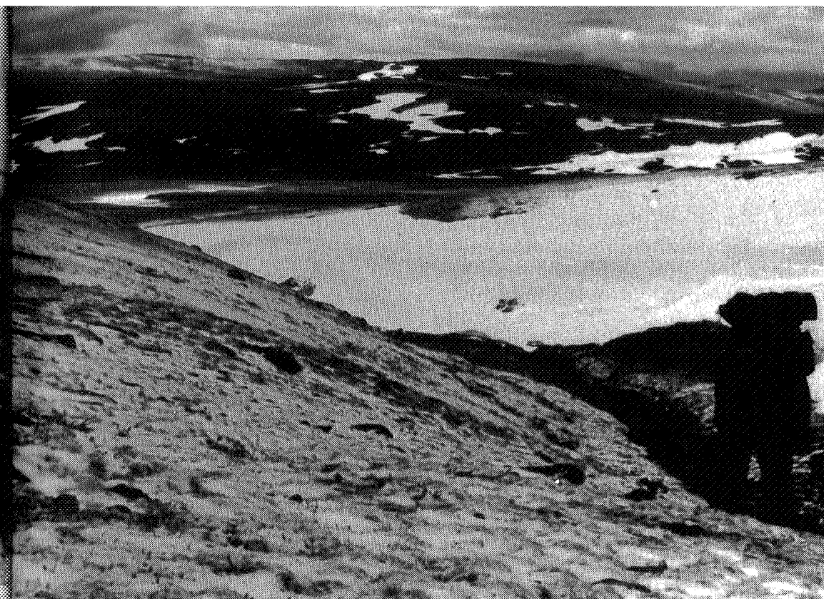
Opp fra Verkensåa

Gautstigen er altså ikke bare «den gamle» men «den eldste» kongeveien over Dovrefjell – for det ferdes nok konger langs Gautstigen også.