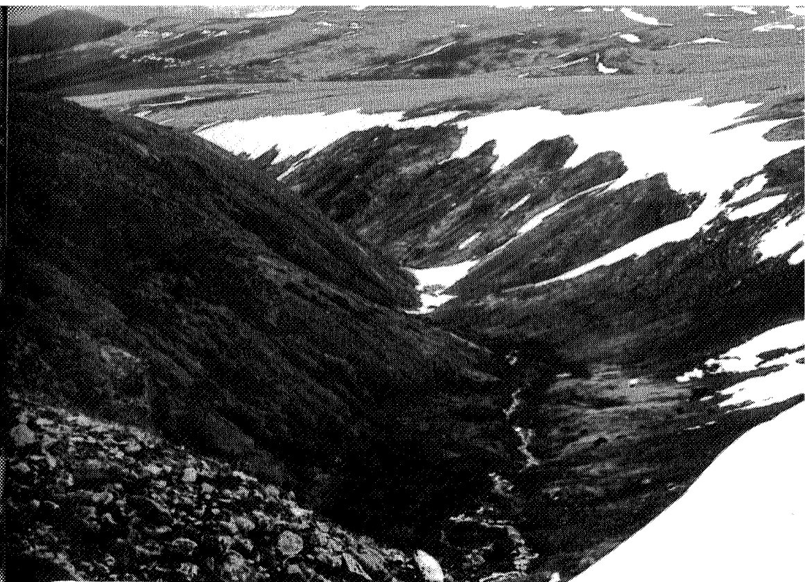
Gjelet i Tverråa