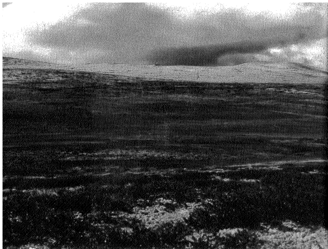
Tunge skyer over Gråsida