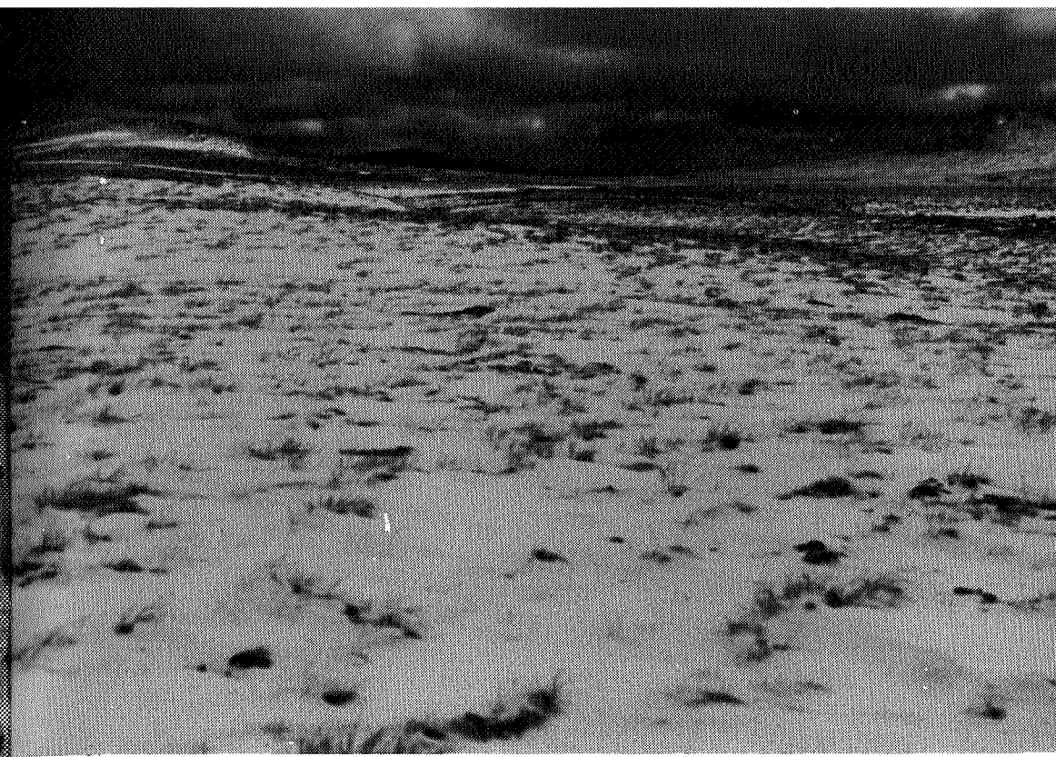
Flate flyer innover mot Kattuglehø (til høyre)