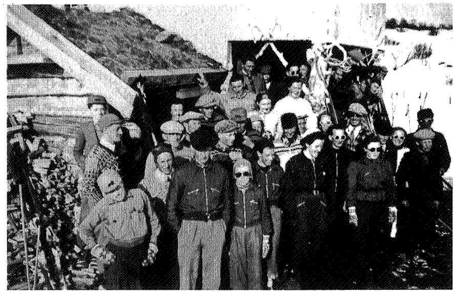
Skiutflukt til Dindalshytta i 1939