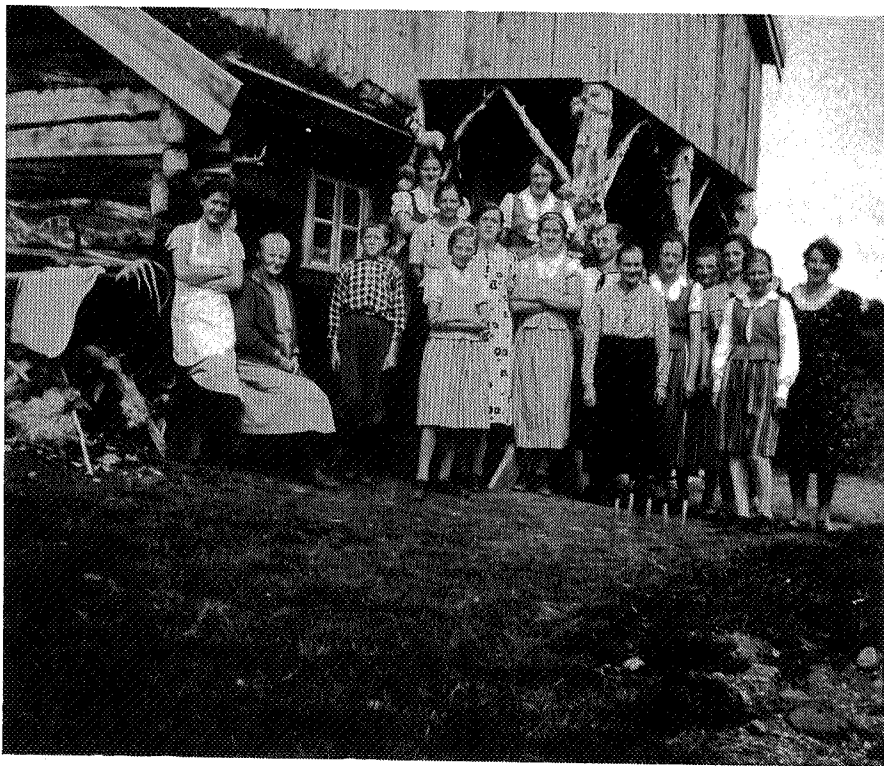
Seterjentelag på Dindalshytta i 1938

nytt og gammelt i flere etapper, og siste påbygg ble gjort i 1945.