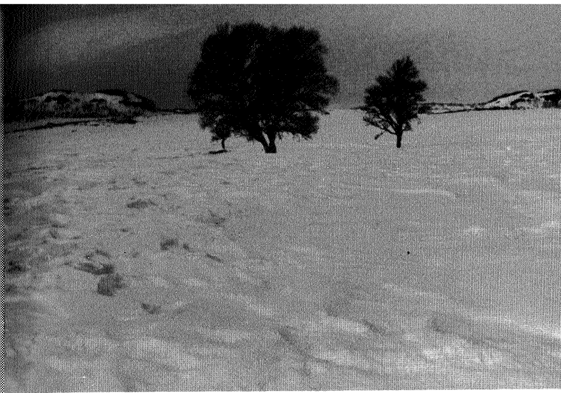
Øst for Vektarhaugene, Tydal

Selv om Herdalssletta fra naturens side var et høvelig sted å hvile