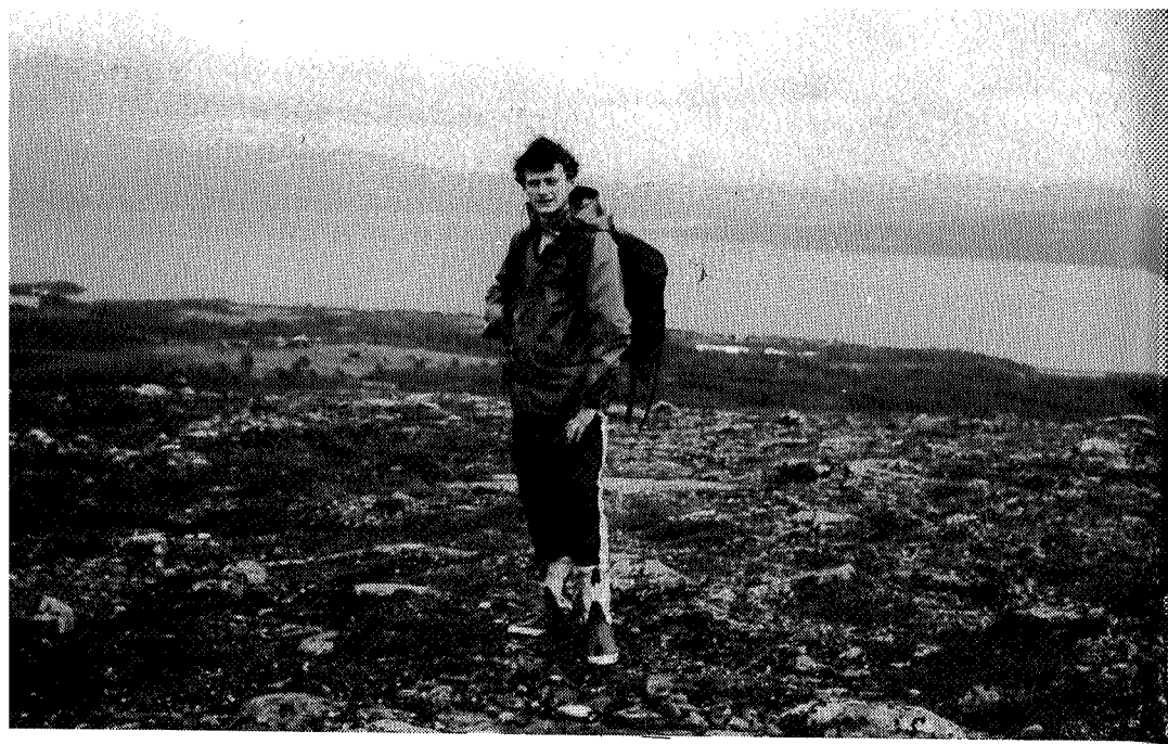
Utsikt mot Storerikvollen og Essandsjøen

Dindalshytta er blitt til i mange byggetrinn. Det begynte med at Hjalmar i 1934 fikk tak i en gammel slåttebu som han satte opp på et engstykke han fikk fra garden Uv. Siden ble det bygget til, både av