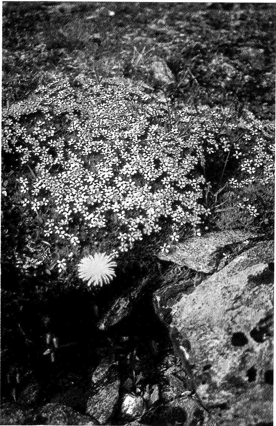
Slike blomar har ingen hage...