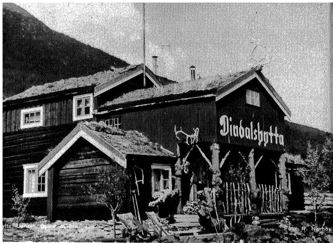
Dindalshytta fotografert i 1946

Dette er en politikk vi vil fortsette å følge – det skal lønne seg å være medlem, og det er medlemmene vi først og fremst skal tilgodese med gode tilbud.