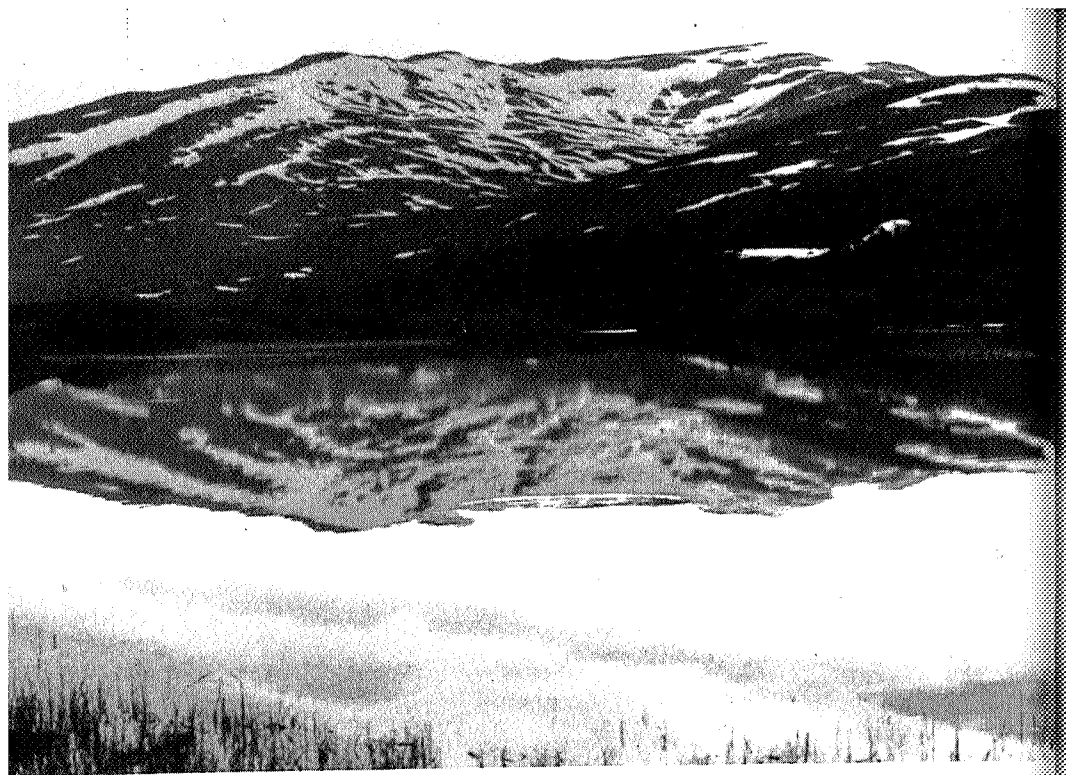
Lille Kvern fjellvannet, Skarvan i bakgrunnen.