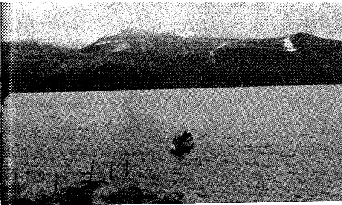
Over Gjevilvatnet mot Okla.

Legen kom og ville ikke sende meg ut på gaten i natten, men lot med skrive inn og hva som følger med det, bl.a. blodprøve og de