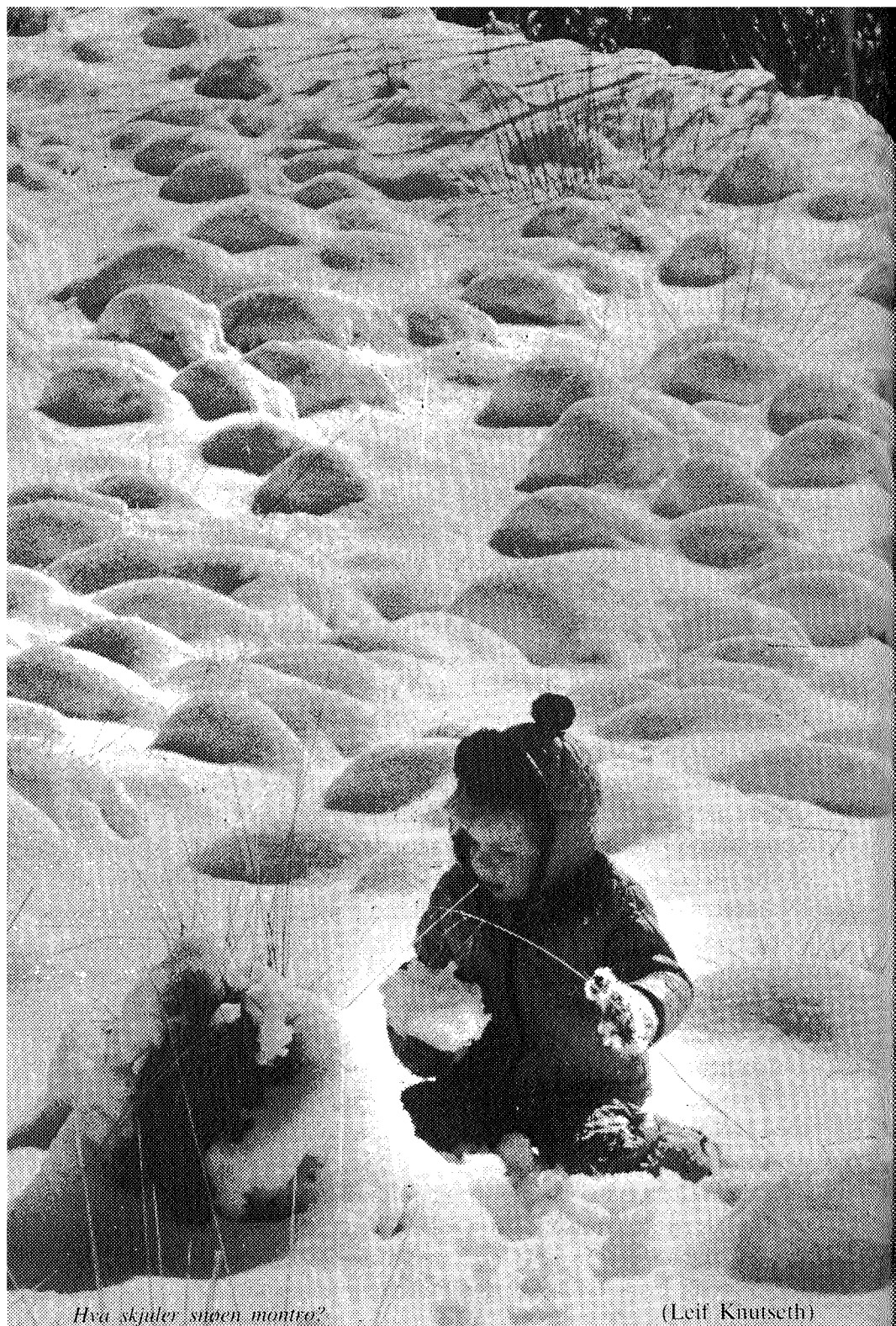
Hva skjuler supen monnø?