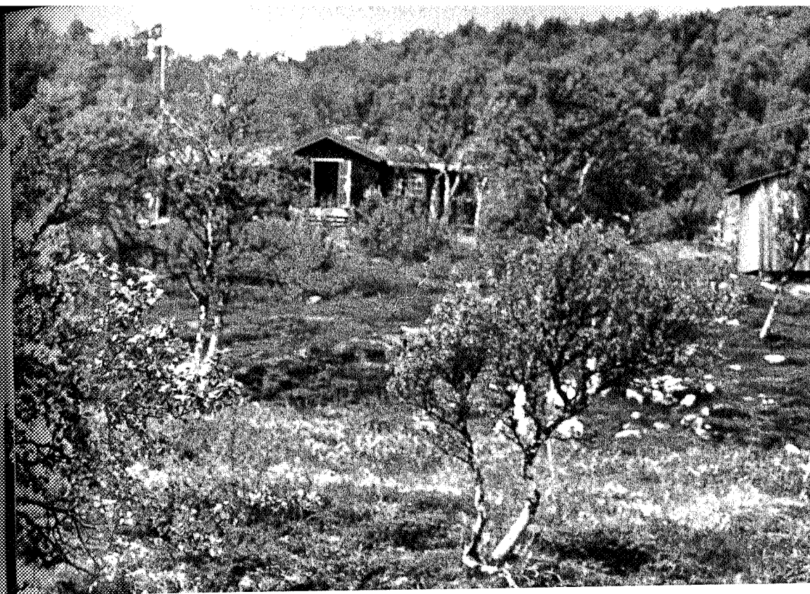
Væktarhaugen seter inngår nå i TT's opplegg som selvbetjeningshytte på ruten fra Nedalen til Kjøli. Setra ligger tre kilometer fra Stugudal, 14 km fra Nedalshytta og 18 km fra Kjøli.

Jeg vil også peke på at TT i 1981 mottok bidrag og gaver fra ulike hold, og foreningen er giverne stor takk skyldig.