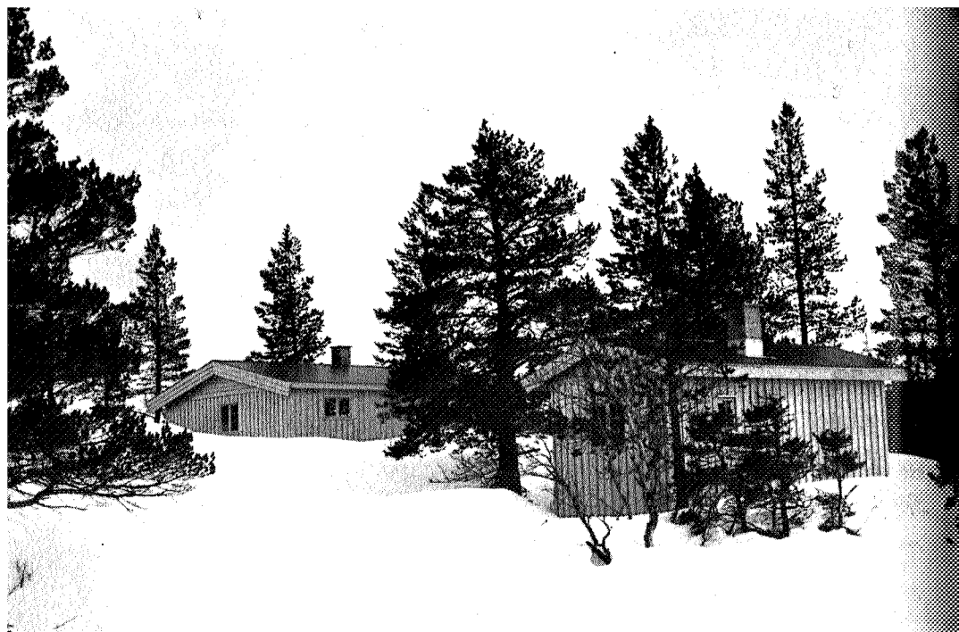
Kvitfjellhytta med uthus.

dige bidrag fra Nord-Trøndelag fylke, Sør-Trøndelag fylke og kommunene Tydal, Selbu og Stjørdal.