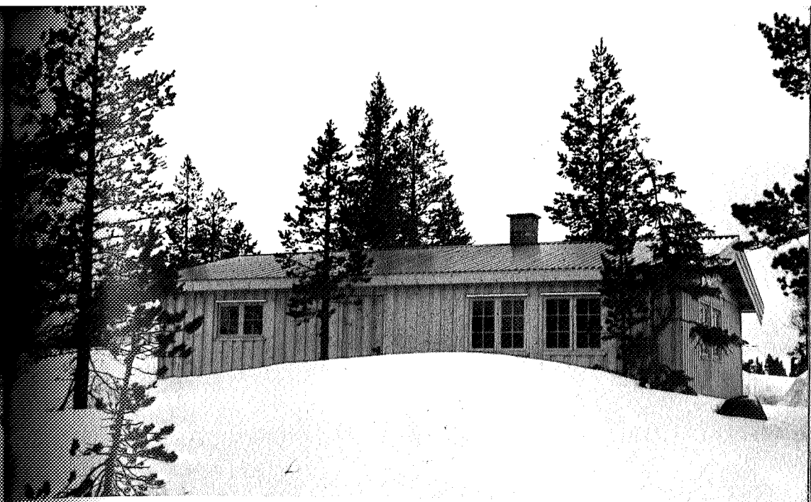
Den nye Kvitfjellhytta ligger pent i terrenget.

På denne del av ruten har vi under merkingen støtt på rester etter trekull - eller tjærebrenning. Disse funnene vil bli nærmere undersøkt og angitt ved skilting.