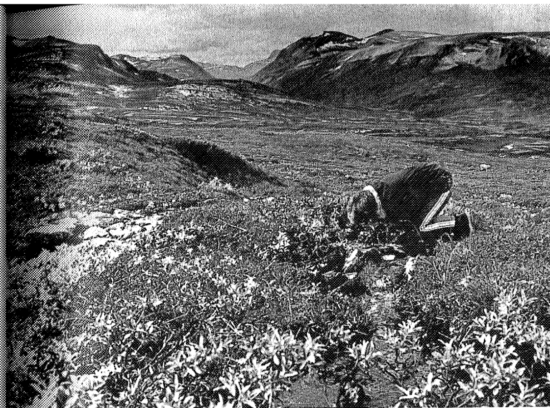
Leskende dråper fra en frisk fjellbekk gjør godt!

På denne måten blir en del av dalene i Vest-Trollheimen vernet, hvilket er meget verdifullt. Særlig Romådalen har mange kvaliteter.