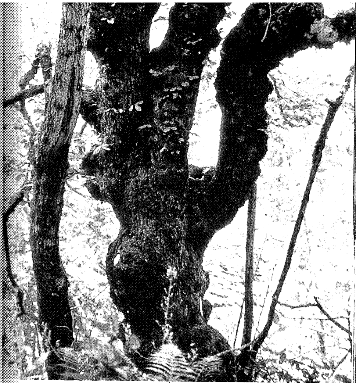
Gammel alm som bærer preg av lauving i Romålia.

Innerst på Tæla, der vatnet tar til å rinne mot Vindøla, satte vi oss og så tilbake. Romådalen. Halvannen mil lang, vid og frodig. Vi var mildt sagt overrasket. At det ennå fantes en intakt seterdal på Nordmøre av denne dimensjon — hvem kunne tro det? Uten å gå nær-