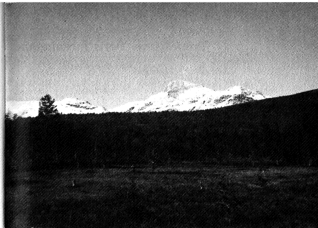
Grønt lov og hvit sno — Snota.