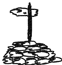
Fra Innerdalen mot Storsola.

Norge har tiltrådt den internasjonale konvensjonen om vern av viktige våtmarker (Ramsarkonvensjonen), og dermed forpliktet seg til å ta vare på denne naturarv, samt å verne om de internasjonale vannfuglbestandene som ikke kjenner landegrenser. Skal dette være en målsetting bør arbeidet med å sikre våre viktigste våtmarker intensiveres og vern gjennomføres for at det skal være mulig å ta vare på et representativt utvalg av disse spesielle naturområder og det liv som er knyttet til dem før det er for sent. Dette gjelder våtmarker både i fjellet og andre steder, våtmarker av internasjonal betydning og områder av mer regional verdi.