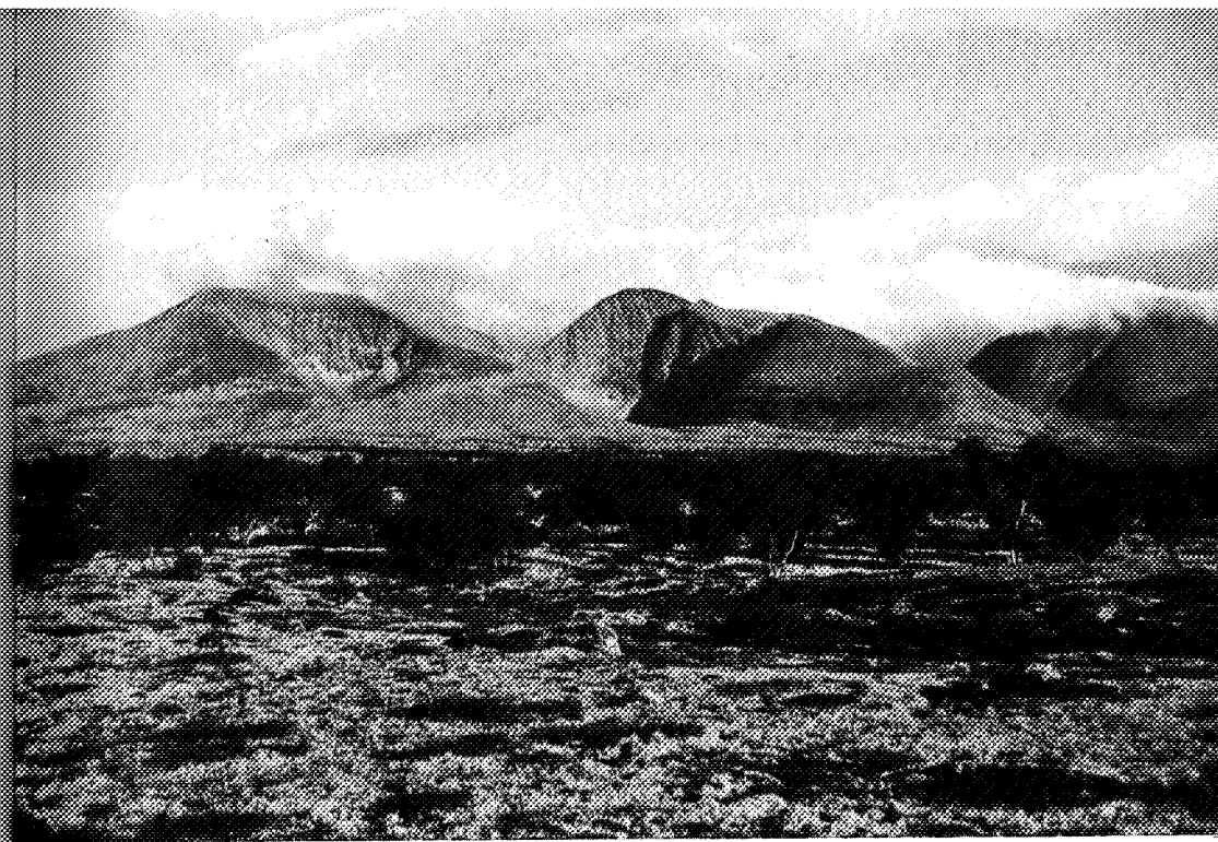
Mot Solen. Øvre Rendal.