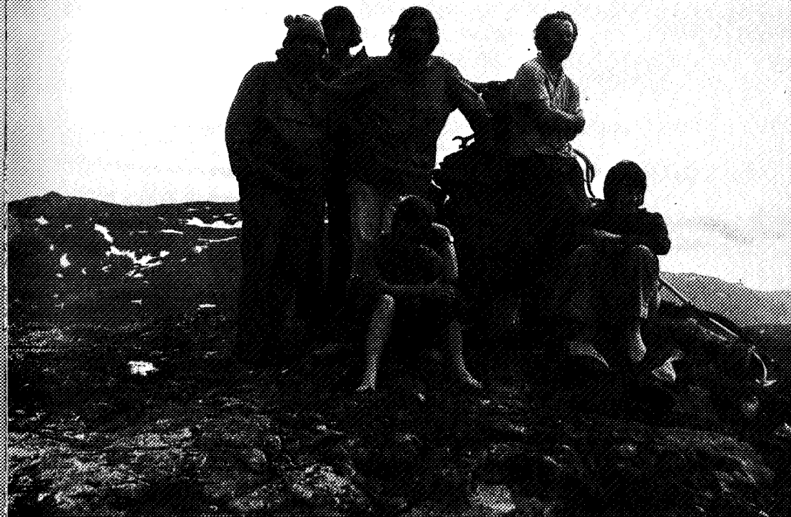
Vår lille gruppe på lille Fongen.

Nu har det aldrig været meningen, at dette korte indlæg skulle analysere dette vanskelige filosofiske problem. Således er det heller ikke hensigten, at behandle turistens forhold til fjeldet. Vi er overbevist om, at andre på mere kvalificeret måde vil skrive om «glæden i fjeldet», om naturen, om opdæmning, om dyrelivet og om dåseøl (tomme) på toppen af Fongen i dette det halvfemsindstyvende nummer af årsskriftet. Hensigten vil alene være, i en række små stemningsglimt, at belyse vor egen glæde ved og i fjeldet, på baggrund af erfaringer igennem snart et halvt års teltning og hytteophold i de norske Syler.