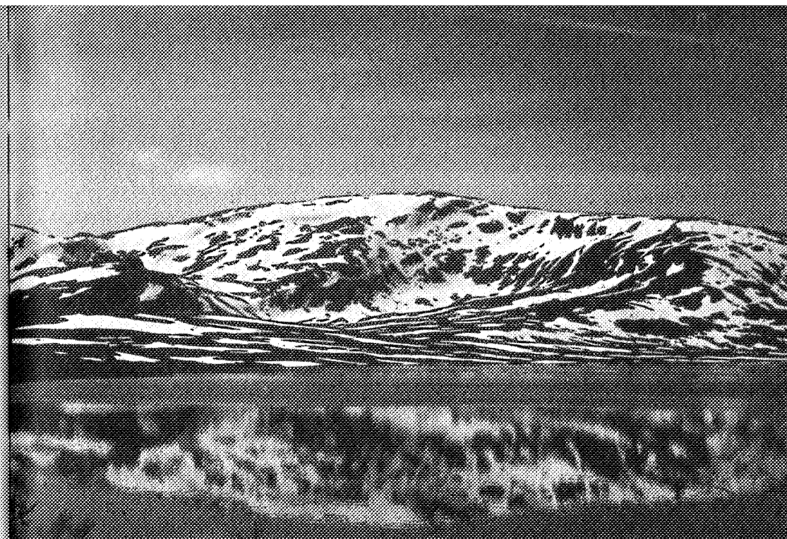
Fongen fra Ramsøhytten.

Mens nogle behjertede personer hjælper os med at få slæbt madresser frem på gulvet, synes resten af idrætsslaget at ville til køjs. Med os