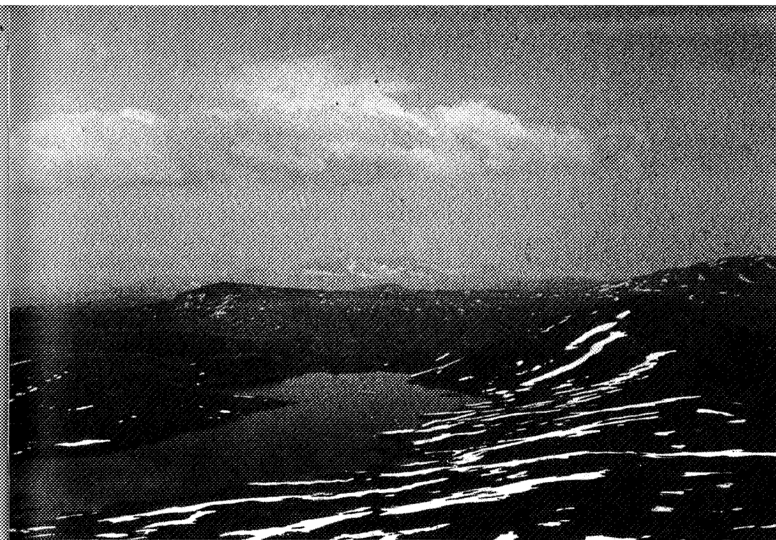
Ramsjoen fra Fongen-toppen.

Turen af stien til Schultzhytten er kendt til trivialitet, særlig farefuld er den de første par hundrede meter, hvor mosevandets indsvivning i de utætte støvler (troede at sværtning kunne vente) ikke er ukendt. Turen videre over de stejle skrænter mod Græslivola er frygtet på grund af disses monotonitet. Vi kender hver eneste sten og enhver græstue. Snart når vi dog ind til Melshogna, og kommer derved ind i en kraftig vind, der blæser fra nordøst. Næsten hele vejen ned i passet mellem Melshogna og Ruten er vi frit eksponeret for vindet, der er så kold og kraftig at vi er