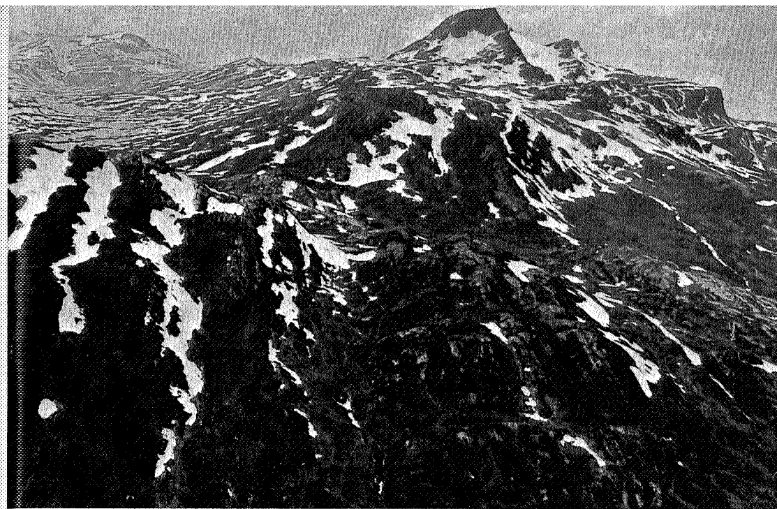
Trollheimen, forsommeren 1975. Bildet er tatt mot Snota med Fagerlidalsvatna t.v. og Grøafjellet i forgrunnen. (Monrad Kjellby)

Vi forutsetter ellers at hyttenes sengetøy aldri nyttes som underlag for hunder. Videre går vi ut fra at enhver hundeeier sørger for å rydde opp og gjøre rent der hunden har hatt sitt leie, der den har spist, og der den har gjort «sitt fornødne».