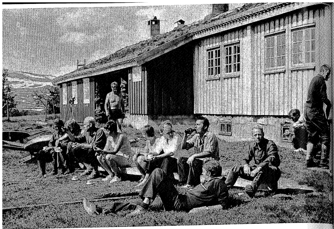
Dugnad på Storerikvollen.