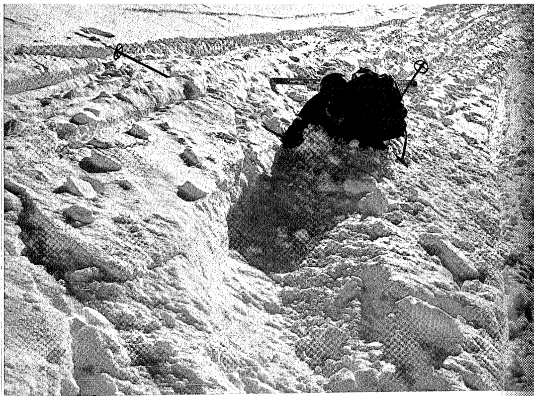
En herlig utforkjøring fra Bjøråskaret.